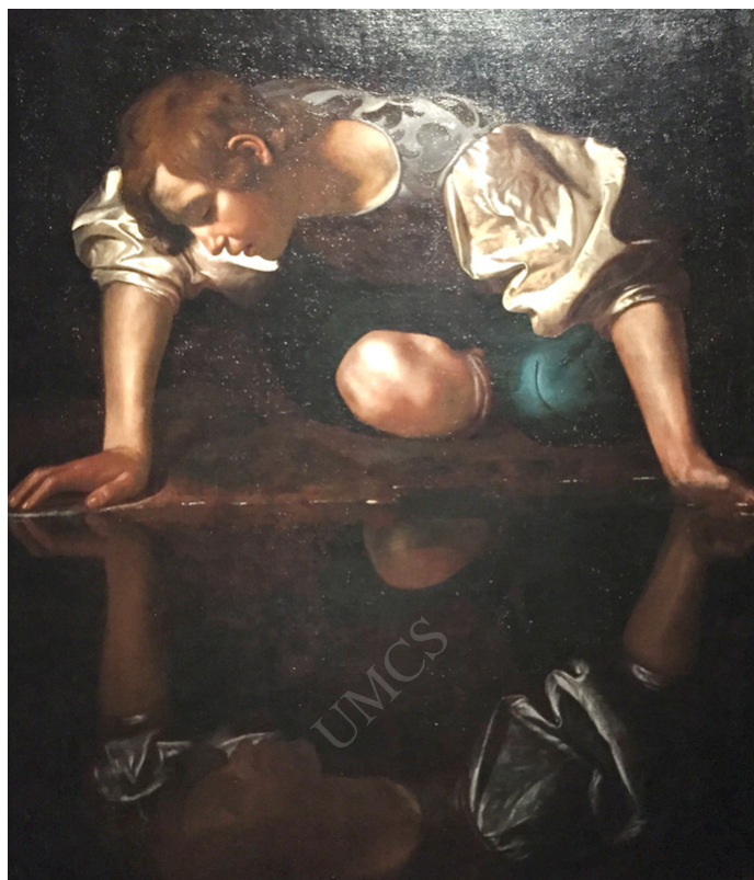
Ilustracja 1. Caravaggio Narcyz , 1597–1599 (Palazzo Barberini w Rzymie)