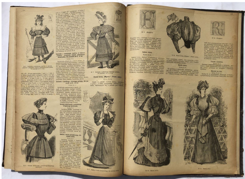
Ryc. 1. „Bluszcz. Pismo tygodniowe ilustrowane dla kobiet” 1894, nr 30 (dodatek)

wzbudza erotyczny pociąg nie tylko u swojego męża, ale i u innych mężczyzn. Co istotne, Franek, który jest świadomy wrażenia, jakie wywiera na otoczeniu jego żona, cieszy się z tego, a nieukrywaną satysfakcję sprawia mu wyobrażanie sobie spotkań na Czystym z mężczyznami, którzy zachwyconym spojrzeniem obdarzą Józkę, jemu zaś będą „znacząco mrugali”. W tej postawie mężczyzna, a zwłaszcza w ich spojrzeniach, Franek będzie odczytywał podziw i pożądanie dla żony, dla siebie zaś męskie uznanie. Józce w ogóle nie przeszkadza ani to, że będzie oglądana przez obcych mężczyzn, ani to, że na ten widok wystawia ją własny mąż oraz... ona sama. Bohaterka nie protestuje zarówno w mieszkaniu, gdzie jest oglądana przez męża (który równocześnie ocenia jej wygląd: „obchodził [ją] ze wszech stron, pociągał, poprawiał. Palcem poślinić już się nie ważył. Brał w zamian szcztokę i czyścił skrupulatnie”; Berent 1992c: 73), jak i podczas wycieczki, gdy co rusz natyka się na uważny męski wzrok. Erotyczna moc spojrzenia znana jest od starożytnej opowieści o Meduzie. Będąc potworem, a w zasadzie potworną emanacją kobiecej seksualności, niosła za sobą i obietnicę rozkoszy, i pożarcie przez śmierć. Toteż „wskutek pożądania, obejmującego