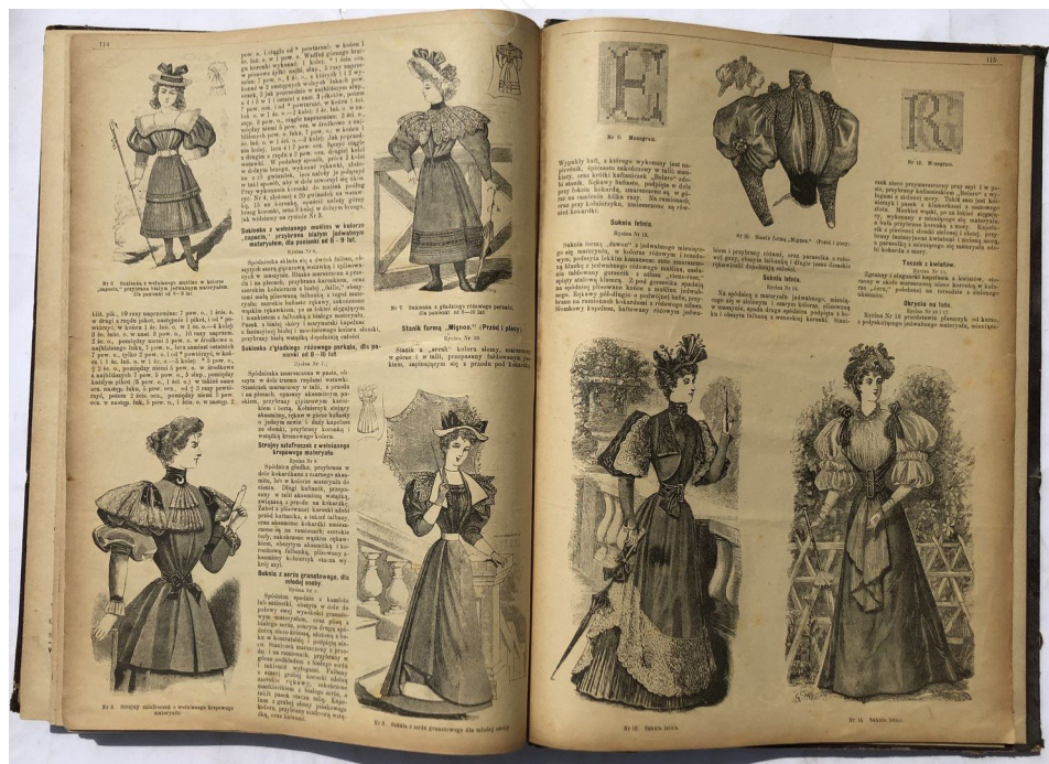
Ryc. 1. „Bluszcz. Pismo tygodniowe ilustrowane dla kobiet” 1894, nr 30 (dodatek)

wzbudza erotyczny pociąg nie tylko u swojego męża, ale i u innych mężczyzn. Co istotne, Franek, który jest świadomy wrażenia, jakie wywiera na otoczeniu jego żona, cieszy się z tego, a nieukrywaną satysfakcję sprawia mu wyobrażenie sobie spotkań na Czystym z mężczyznami, którzy zachwyconym spojrzeniem obdarzą Józkę, jemu zaś będą „znacząco mrugali”. W tej postawie mężczyzna, a zwłaszcza w ich spojrzeniach, Franek będzie odczytywał podziw i pożądanie dla żony, dla siebie zaś męskie uznanie. Józce w ogóle nie przeszkadza ani to, że będzie oglądana przez obcych mężczyzn, ani to, że na ten widok wystawia ją własny mąż oraz... ona sama. Bohaterka nie protestuje zarówno w mieszkaniu, gdzie jest oglądana przez męża (który równocześnie ocenia jej wygląd: „obchodził [ją] ze wszech stron, pociągał, poprawiał. Palcem poślinić już się nie ważył. Brał w zamian szcztokę i czyścił skrupulatnie”; Berent 1992c: 73), jak i podczas wycieczki, gdy co rusz natyka się na uważny męski wzrok. Erotyczna moc spojrzenia znana jest od starożytnej opowieści o Meduzie. Będąc potworem, a w zasadzie potworną emanacją kobiecej seksualności, niosła za sobą i obietnicę rozkoszy, i pożarcie przez śmierć. Toteż „wskutek pożądania, obejmującego