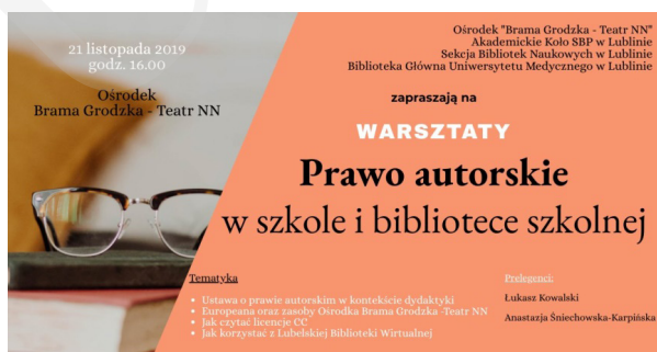
Fot. 5. Zaproszenie na warsztaty „Prawo autorskie”.

6. „Prawo autorskie w szkole i bibliotece szkolnej” – warsztaty odbyły się 21 listopada 2019 r. w godz. 16.00–18.00. Organizatorami byli: Teatr NN Ośrodek Brama Grodzka, Akademickie Koło SBP w Lublinie, Sekcja Bibliotek Naukowych SBP Oddział Lublin, Biblioteka Główna Uniwersytetu Medycznego w Lublinie. Warsztaty zgromadziły 37 uczestników (fot. 5).