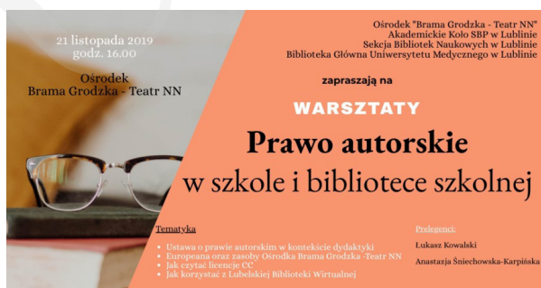
Fot. 5. Zaproszenie na warsztaty „Prawo autorskie”.

6. „Prawo autorskie w szkole i bibliotece szkolnej” – warsztaty odbyły się 21 listopada 2019 r. w godz. 16.00–18.00. Organizatorami byli: Teatr NN Ośrodek Brama Grodzka, Akademickie Koło SBP w Lublinie, Sekcja Bibliotek Naukowych SBP Oddział Lublin, Biblioteka Główna Uniwersytetu Medycznego w Lublinie. Warsztaty zgromadziły 37 uczestników (fot. 5).