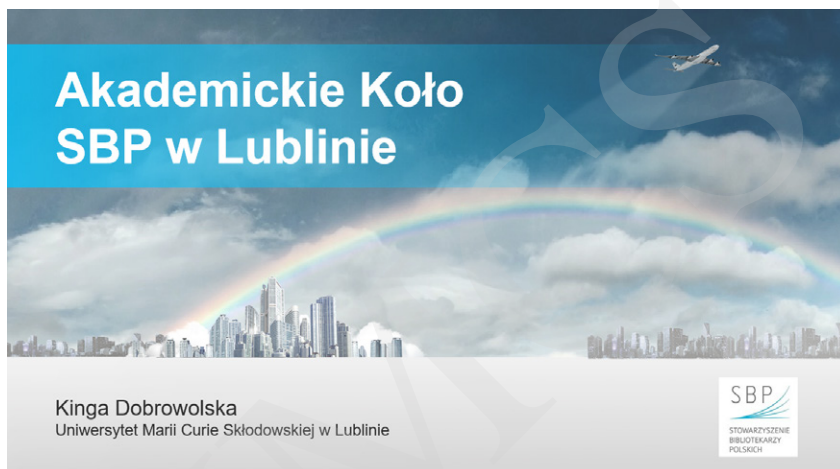
Fot. 1. Fragment prezentacji.

– w chwili obecnej to jedyna laureatka tej prestiżowej nagrody wśród bibliotekarzy akademickich.