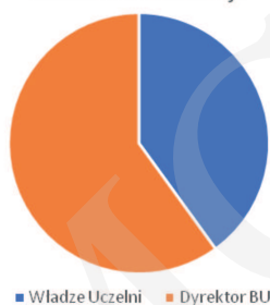
Rycina 3. Podległość służbowa bibliotekarzy biorących udział w ewaluacji.

W zakresie wsparcia uczelni przez pracowników konkretnego działu biblioteki (lub utworzenia nowego na potrzeby ewaluacji) okazało się, że wiodącą rolę odgrywają działy informacji naukowej; taka sytuacja ma miejsce w aż 13 spośród 18 badanych jednostek.