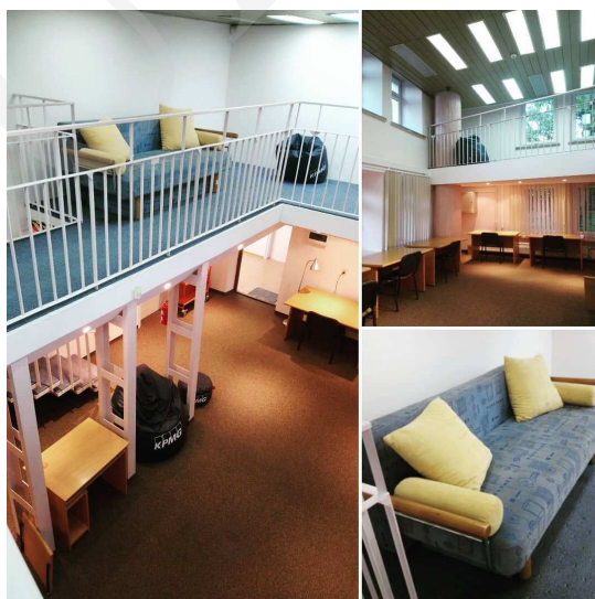
Fot. 3. Strefa relaksu i nauki w Bibliotece Głównej UMCS.