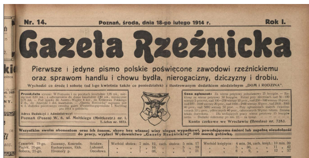
Ryc. 3.

Następny element winyety to informacje o częstotliwości. W pierwszym roczniku jest nieregularna – dwa razy w tygodniu: co środę i sobotą od numeru 1. do 19., trzy razy w tygodniu: co poniedziałek, środę i sobotą od numeru 20. do 76., ponownie dwa razy: co poniedziałek i czwartek w numerach 77. i 78. oraz co środę i sobotą od numeru 79. do 111. Numery od 104. do 107. pomimo oznaczenia: co środę i sobotą wydawane były 1 raz w tygodniu, w soboty. W tej części występuje informacja o dodatku niedzielnym „Dom i rodzina” w numerach: od numeru 2. (7 stycznia 1914) do numeru 69. (18 lipca 1914). Od numeru 72. brakuje dodatku niedzielnego. W 1918 r. gazeta była wydawana regularnie jako tygodnik co sobotę. Niżej zamieszczono dwie ramki z informacjami, po lewej stronie warunki przedpłat, adres redakcji i administracji, po prawej ceny ogłoszeń, rabaty stosowane przy ogłoszeniach większych i stałych oraz numer konta czekowego we Wrocławiu i Wiedniu. Pomiędzy ramkami znajduje się rysunek podobny do tego, który widnieje na pieczęci Cechu Rzeźników w Poznaniu: głowa byka na tle dwóch skrzyżowanych toporów, otoczony ramką. Pod nimi dwa ostatnie elementy występujące w pierwszym roczniku: informacja o ubezpieczeniu abonentów i ich rodzin oraz oddzielony kreską kalendarzyk z informacjami o imienninach, wschodach i zachodach słońca oraz księżycy na najbliższe dni, do następnego wydania.