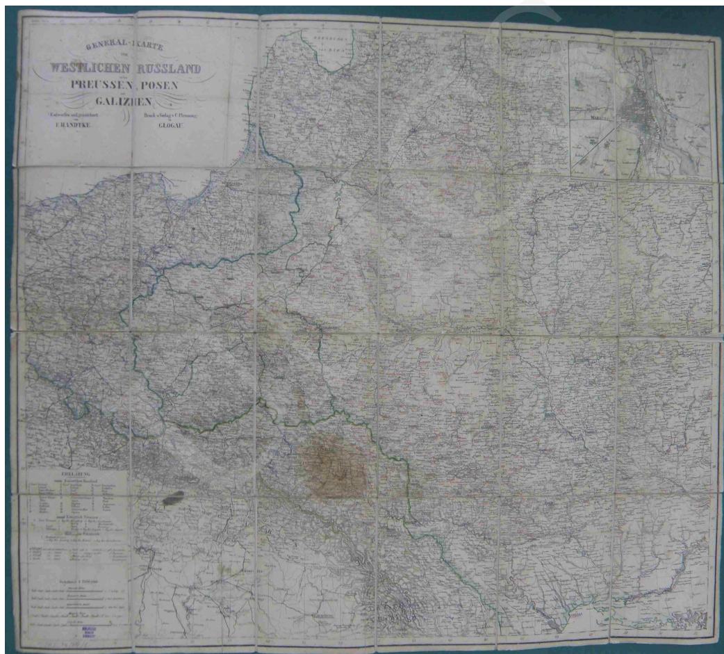
Fot. 14. General-Karte vom Westlichen Russland nebst Preussen, Posen und Galizien entworfen und gezeichnet von F. Handtke

Na mapie (fot. 14) rzeźba terenu została przedstawiona za pomocą metody kreskowej, granice zaś oznaczono kolorami. W lewym dolnym rogu umieszczono legendę oraz skalę liczbową i 5 podziałek liniowych. Dodatkowo, w prawym górnym rogu, widnieje mapa okolic Warszawy w skali ok. 1: 90 000. Mapa jest podklejona na płótnie i umieszczona w ramce.