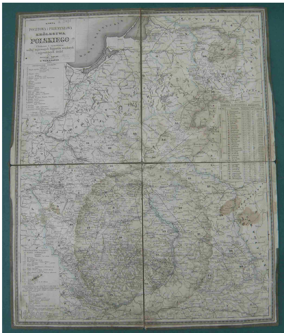
Fot. 7. Karta pocztowa i przemysłowa Królestwa Polskiego, ułożona i rysowana według najnowszych raportów urzędowych i najpewniejszych źródeł przez Jerzego Engloffa

ważności. Elementy komunikacji wodnej zostały oznaczone sygnaturą obrazkową kanałów i rzek spławnych, natomiast urzędy i stacje pocztowe – sygnaturą symboliczną – trąbką pocztyliona. Komory celne podzielono na 3 klasy. Odległości przy traktach pocztowych w granicach Królestwa Polskiego podano w wiorstach, a poza jego granicami w milach, głównie przy ważniejszych traktach pocztowych.