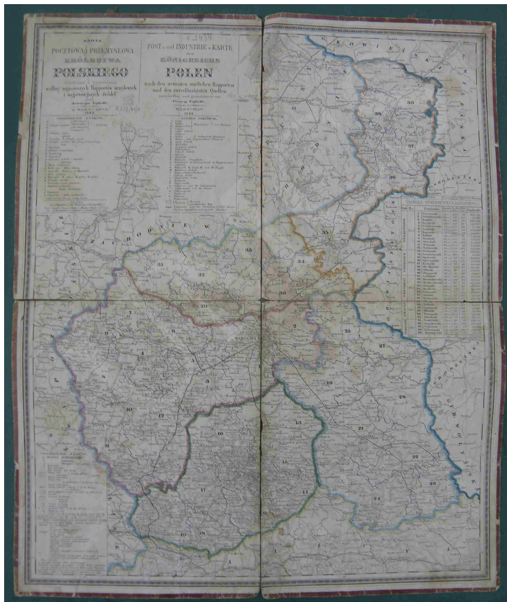
Fot. 11. Karta pocztowa i przemysłowa Królestwa Polskiego. Ułożona i rysowana według najnowszych raportów urzędowych i najpewniejszych źródeł przez Jerzego Engloffa