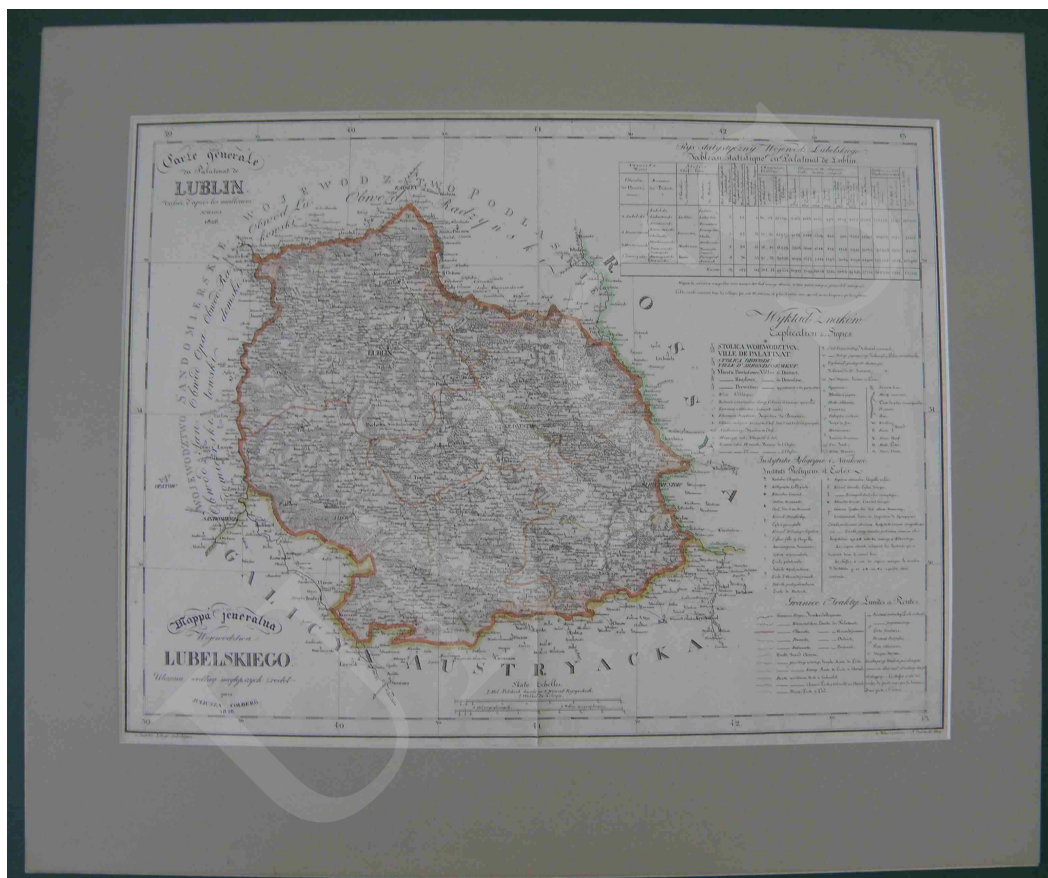
Fot. 12. Mapa jeneralna województwa lubelskiego ułożona według najlepszych źródeł przez Juliusza Colberga

Natomiast mapa województwa lubelskiego (fot. 12) została wykonana techniką litografii ręcznie kolorowanej, z zaznaczonymi granicami politycznymi i administracyjnymi. Na rysunek sytuacyjny mapy składają się elementy matematyczne, fizyczno-geograficzne, społeczno-gospodarcze oraz polityczno-administracyjne. Treść mapy uzupełniają umieszczone na arkuszu tabele statystyczne.