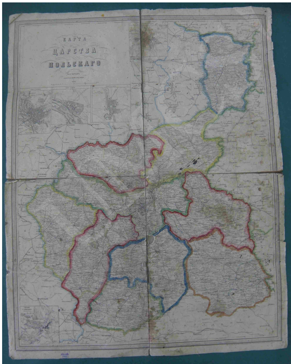
Fot. 6. Karta Carstwa Polskago