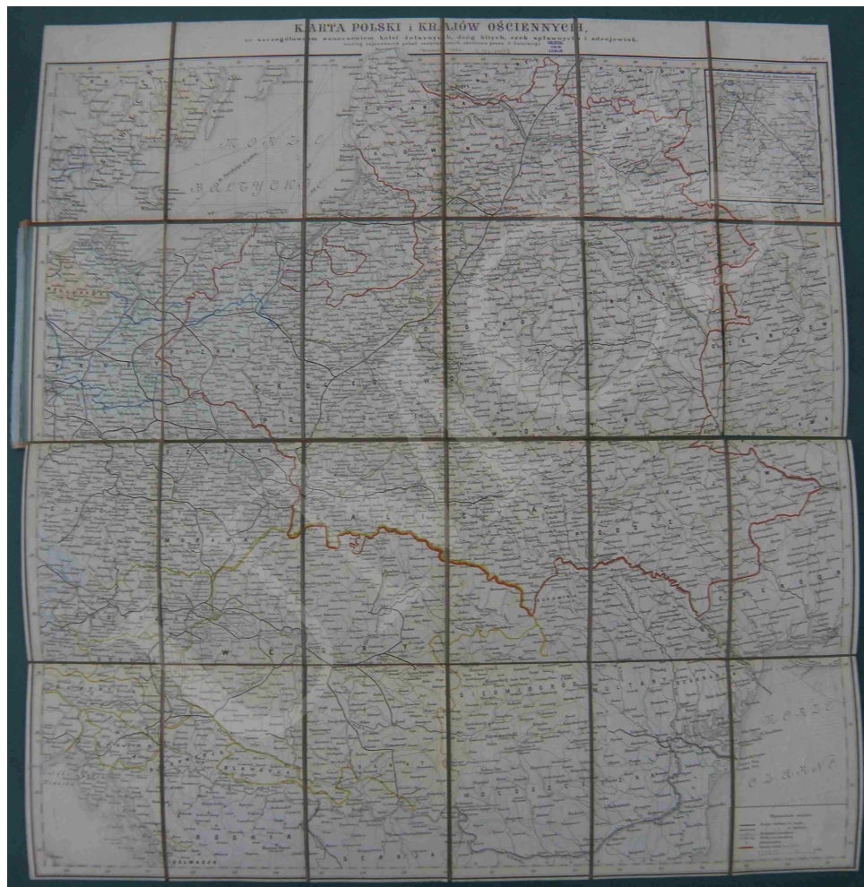
Fot. 5. Karta Polski i krajów ościennych, ze szczegółowym oznaczeniem kolei żelaznych, dróg bitych, rzek splawnych i zdrojowisk, według najnowszych podań statystycznych, skreślona przez J. Osieckiego

delikatnej szrafury (rodzaj cieniowania graficznego). Miasta sklasyfikowano według funkcji administracyjnej, trakty pocztowe podzielono na trakty główne, wśród których wyróżniono drogi bite i zwyczajne. Wszystkie te elementy przedstawiono różnymi rodzajami linii podwójnej. J. Engloff zamieścił na mapie też drogi bite projektowane i w budowie oraz inne drogi zwyczajne o mniejszym znaczeniu. Linie kolejowe wyrysowano za pomocą pogrubianej linii ciągłej z poprzecznymi kreskami i uzupełniono oznaczeniem stacji kolejowych z rozróżnieniem trzech klas