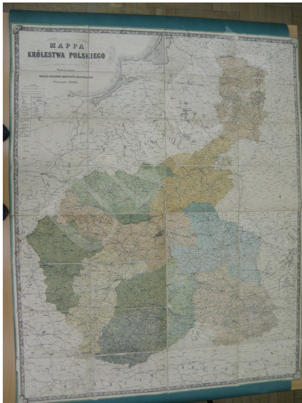
Fot. 2. Mapa Królestwa Polskiego ułożona przez M. Nipanicza