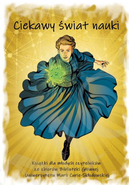
Fot. 1. Plakat reklamujący wystawę, autorstwa I. Mielniczuk i M. Zawady, zamieszczony na witrynie internetowej BG UMCS oraz ustawiony na wejściu przed wystawą.

Książki zaprezentowano na stołach i mobilnych ekspozytorach w kilku blokach tematycznych, np. astronomia, medycyna, historia itp. Przy każdym przygotowano tablice z ciekawymi informacjami oraz postaciami ze świata nauki. Uzupełnieniem prezentowanych pozycji książkowych był stary sprzęt techniczny w postaci dwóch telefonów tarczowych oraz maszyn do pisania. Dla odwiedzających przygotowano strefę relaksu, w której można było odpocząć i poczytać. Obok znajdował się kącik plastyczny, w którym najmłodszy odwiedzający mieli możliwość uwiecznienia wrażeń z wystawy. Pozostawione przez nich dzieła były prezentowane na specjalnej tablicy umieszczonej obok wystawy.