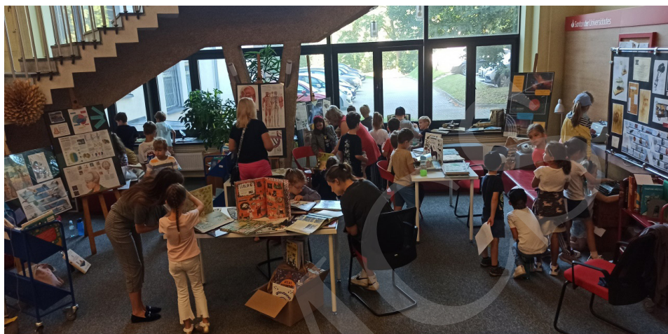
Fot. 2. Wystawa, fot. I. Mielniczuk.

Podczas 5 dni XIX Lubelskiego Festiwalu Nauki wystawę odwiedziło 20 zorganizowanych grup uczniów reprezentowanych przez klasy 0–8 szkół podstawowych z Lublina i okolic, przedszkolaki oraz osoby prywatne zainteresowane literaturą dziecięcą. W sumie wystawę odwiedziło 431 osób.