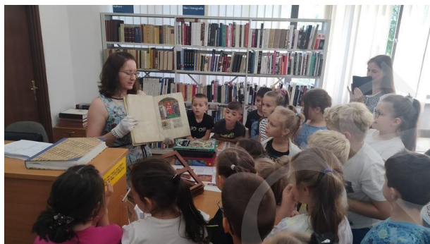
Fot. 7. Warsztaty „Iluminowany inicjał” – wprowadzenie teoretyczne