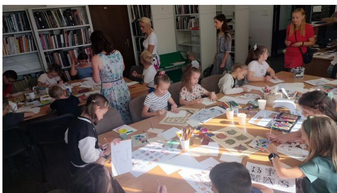
Fot. 8. Uczniowie podczas pracy warsztatowej – projektowanie iluminowanego inicjału