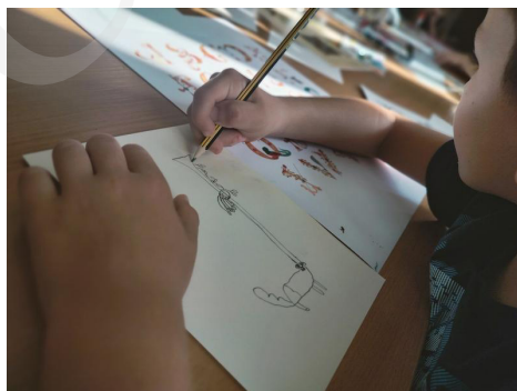
Fot. 6 . Projektowanie inicjału, fot. A. Mikulska.

Bogactwo fantazyjnych inicjałów oraz wibrujących kolorem wielobarwnych bordiur zainspirowało do działań twórczych uczestników warsztatów kreatywnych, przygotowanych w Oddziale Zbiorów Specjalnych dla zorganizowanych grup szkolnych.