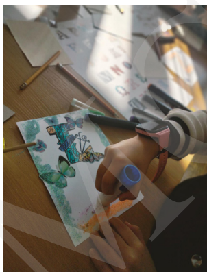
Fot. 10. Twórcze poszukiwania w pracy nad inicjałem, fot. A. Mikulska.

ficznych. Była również czasem efektywnej współpracy budującej wiedzę i umiejętności uczestników oraz wzbogacającej doświadczenie dydaktyczne bibliotekarzy. Historyczne zbiory z bibliotecznych półek zabrały uczestników w podróż w czasie od zarania dziejów przez tajemnicze wnętrza średniowiecznych skryptoriów, ukazując ponadczasowość sztuki, idącej w parze z nauką w korowodzie ku przyszłości.