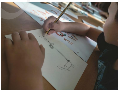
Fot. 6 . Projektowanie inicjału, fot. A. Mikulska.

Bogactwo fantazyjnych inicjałów oraz wibrujących kolorem wielobarwnych bordiur zainspirowało do działań twórczych uczestników warsztatów kreatywnych, przygotowanych w Oddziale Zbiorów Specjalnych dla zorganizowanych grup szkolnych.