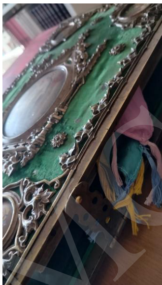
Fot. 4. Biblia w kunsztownie wykonanej oprawie, fot. A. Mikulska.

Duże wrażenie wywarła prezentacja najstarszych zasobów bibliotecznych, sięgających początków rozwoju druku, jak Biblia w przekładzie Marcina Lutera z 1686 roku o objętości około 4 tysięcy stron i wadze kilku kilogramów. Imponujące księgi oprawne w okładki wykonane z desek pokrytych tłoczoną skórą czy aksamitnym sukniem i opatrzonych dekoracyjnymi okuciami zaintrygowały odwiedzających, zapraszając do refleksji nad wartością oraz rozwojem książki w aspekcie historycznym i kulturalnym.