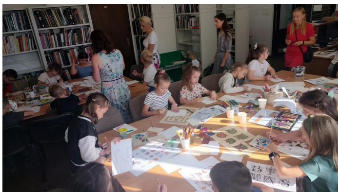
Fot. 8. Uczniowie podczas pracy warsztatowej – projektowanie iluminowanego inicjału