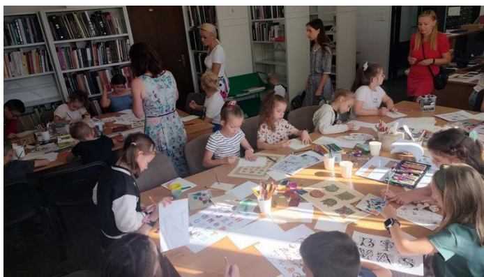
Fot. 8. Uczniowie podczas pracy warsztatowej – projektowanie iluminowanego inicjału