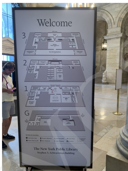
Fot. 2. Plan zwiedzania Biblioteki, fot. A. Strumińska.