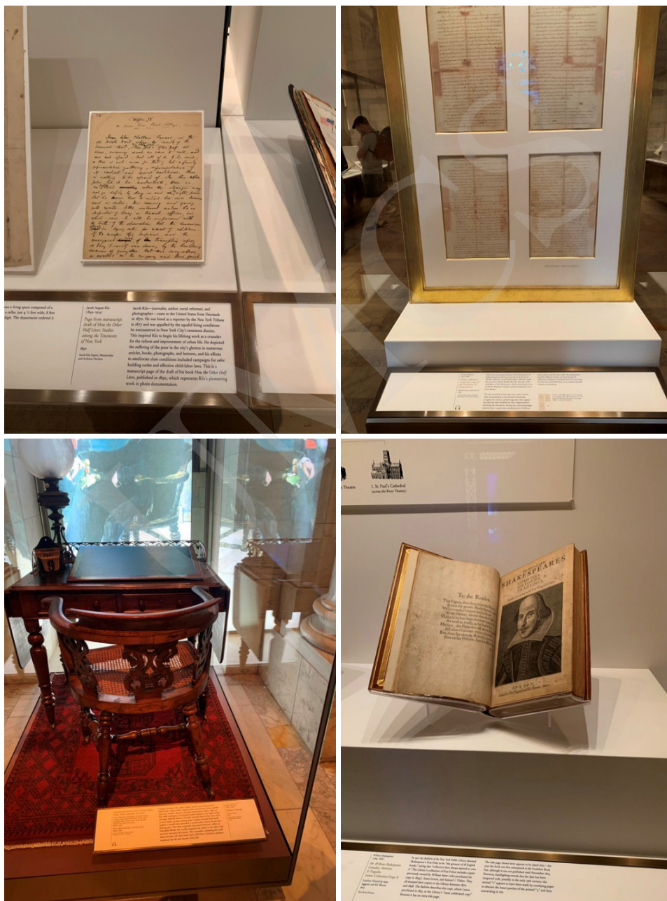
Fot. 6. Zbiory Nowojorskiej Biblioteki, fot. A. Strumińska.

W zbiorach Nowojorskiej Biblioteki Publicznej znajduje się wiele cennych dzieł, takich jak: Biblia Gutenberga czy rękopis Deklaracji Niepodległości napisany przez