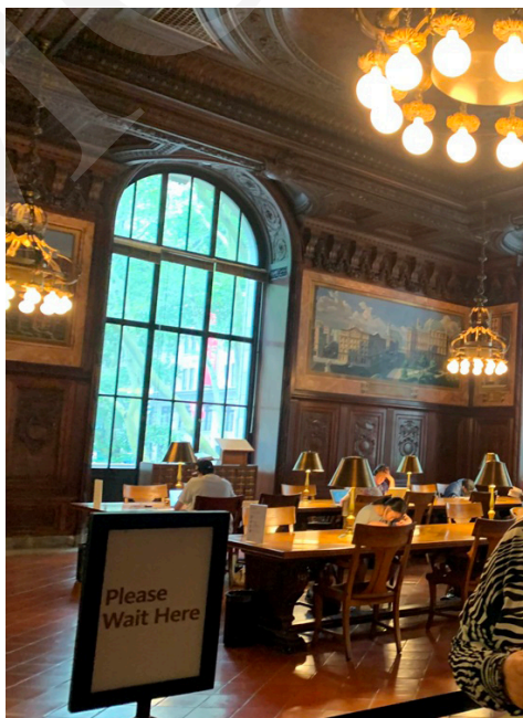
Fot. 5. Czytelnia Biblioteki

Biblioteka ma również ofertę dla najmłodszych. W podziemiach budynku znajduje się czytelnia dla dzieci. Wejścia do niej chroni lew wykonany z klocków lego. Najważniejszym eksponatem tej części biblioteki są pluszaki. Od 1987 roku w Nowojorskiej Bibliotece mieszka Kubuś Puchatek i jego przyjaciele: Prosiaczek, Kłapouchy, Kangurek i Tygrysek. Jak się dowiedziałam, to oryginalne maskotki małego chłopca Christopa Robina Milne, które stały się inspiracją dla jego Taty – Alana A. Milne do napisania najsłynniejszej i najpiękniejszej na świecie książki dla dzieci.