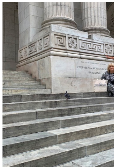
Fot. 1. The New York Library.