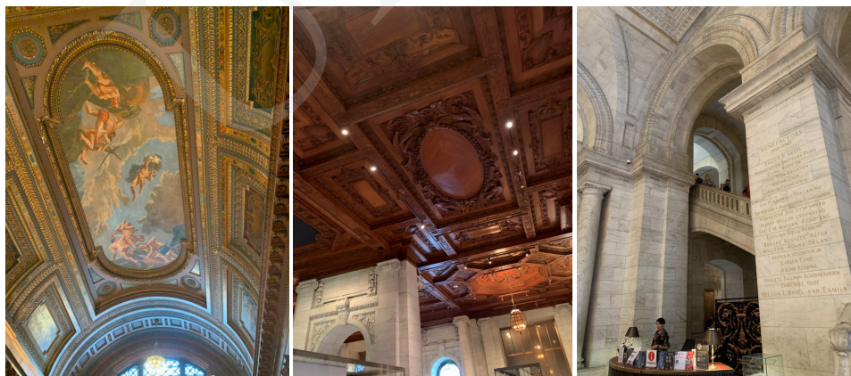
Fot. 3. Wnętrze Biblioteki, fot. A. Strumińska.

Zbiory Nowojorskiej Biblioteki rosną w zawrotnym tempie i obecnie część magazynów znajduje się poza budynkiem biblioteki, ale w jej bezpośrednim sąsiedztwie – pod pobliskim Bryant Parkiem, który zachwyca alejami londyńskich platanów 2 .