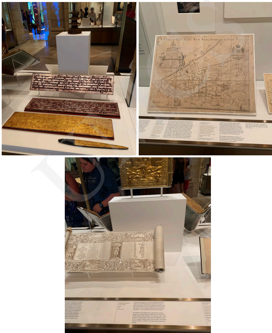
Fot. 7. Zbiory Nowojorskiej Biblioteki

Thomasa Jeffersona, oryginalny list Admirala Floty – Krzysztofa Kolumba do króla Hiszpanii z 15 lutego 1493 roku o tym, że odkrył Amerykę 3 .