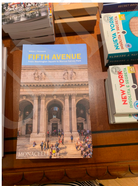
Fot. 8. Oferta sklepu w Bibliotece, fot. A. Strumińska.

Biblioteka posiada również swój sklep. Można tam kupić książki, kalendarze, a także różne gadżety pamiątkowe.