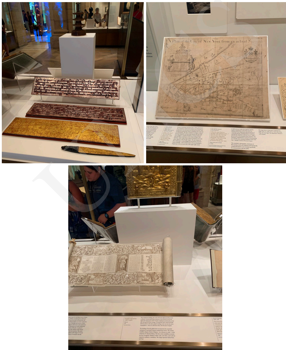
Fot. 7. Zbiory Nowojorskiej Biblioteki

Thomasa Jeffersona, oryginalny list Admirala Floty – Krzysztofa Kolumba do króla Hiszpanii z 15 lutego 1493 roku o tym, że odkrył Amerykę 3 .