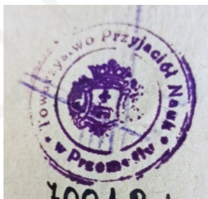
Ryc. 7. Pieczętka biblioteczna Towarzystwa Przyjaciół Nauk w Przemysłu.

Kolejnym znalezionym znakiem własnościowym jest pieczętka Księgarni Arctów w Lublinie (1838–1933) – rodzinnej firmy wydawniczo-księgarskiej rodu Arctów. Księgarnia została założona przez Stanisława Arcta 21 w Lublinie w 1836 r. 22 Jednocześnie z otwarciem księgarni, w celach dochodowych Arct uruchomił wypożyczalnię książek. Początkowo oferowała ona ponad 4 tys. aktualnych polskich tytułów i około 1,2 tys. francuskich, po kilku latach została poszerzona o szeroko promowaną literaturę dziecięcą i młodzieżową 23 . Klienci mieli możliwość dokonywania zakupów bezpośrednio w księgarni lub drogą wysyłkową 24 . Od 1852 r. przedsiębiorstwo S. Arcta przestało być tylko księgarnią, pojawiły się pierwsze książki wydane przez jego oficynę. Prowadzenie wydawnictwa przejął bratanek Michał Arct, który w 1881 r. objął rodzinny interes i przeniósł go do Warszawy 25 . Działalność wydawnictwa była kontynuowana przez jego potomków, a w 1922 r. firma została przekształcona w spółkę akcyjną. Po wojnie Jerzy Arct postanowił reaktywować rodzinny biznes, który działał do 1953 r. jako Księgarnia Arcta 26 .