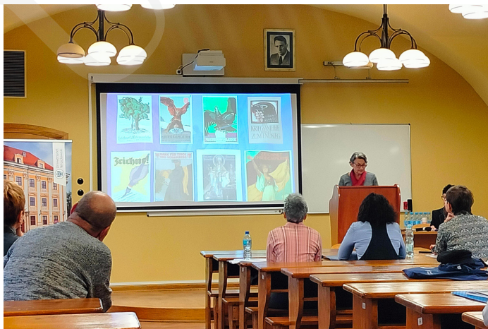
Fot. 2. Prezentacja jednego z wystąpień.