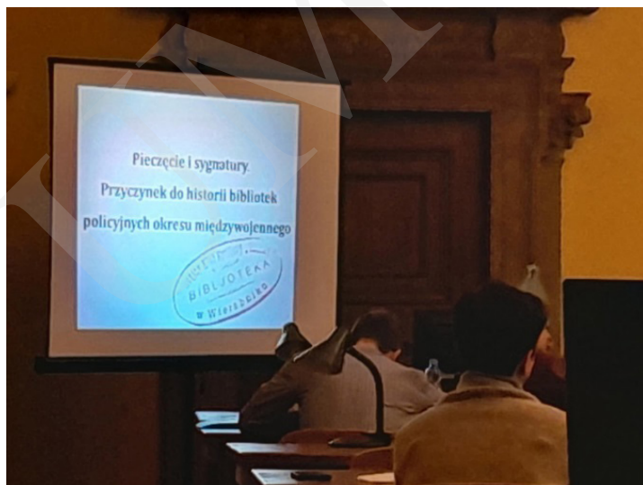
Fot. 10. Prezentacja jednego z wystąpień.