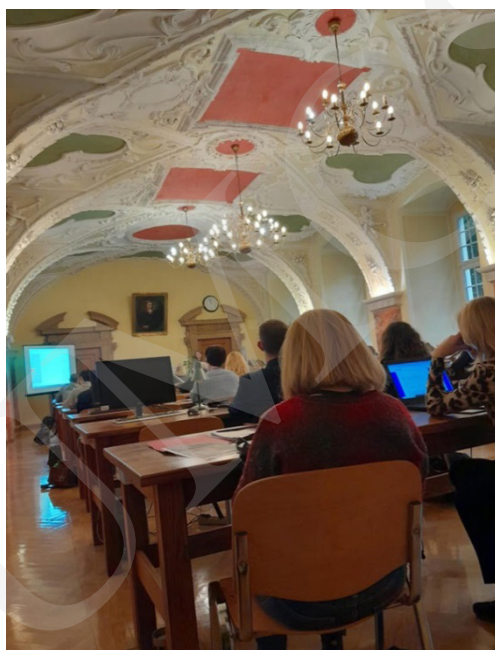
Fot. 9. Prezentacja jednego z wystąpień.

króla, „wziąć pod rękę Marsa, by wspomagać go w lepszych czasach”. Tło polityczne stanowił powrót Króla Zygmunta III Wazy z podróży do Szwecji, a wątki poruszane w poemacie są odwołaniem do złych nastrojów i bezprawia, jakie opanowały Starą Warszawę i Nowe Miasto.