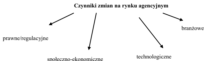
Rys. 1. Czynniki zmian na rynku agencyjnym

Kanał agencyjny ulega i będzie ulegał różnego rodzaju zmianom. Czynniki, które wpływają na ten kanał dystrybucji możemy podzielić na makroekonomiczne, o charakterze prawnym (regulacyjnym), społeczno-ekonomicznym, technologicznym oraz branżowe (rys. 1).