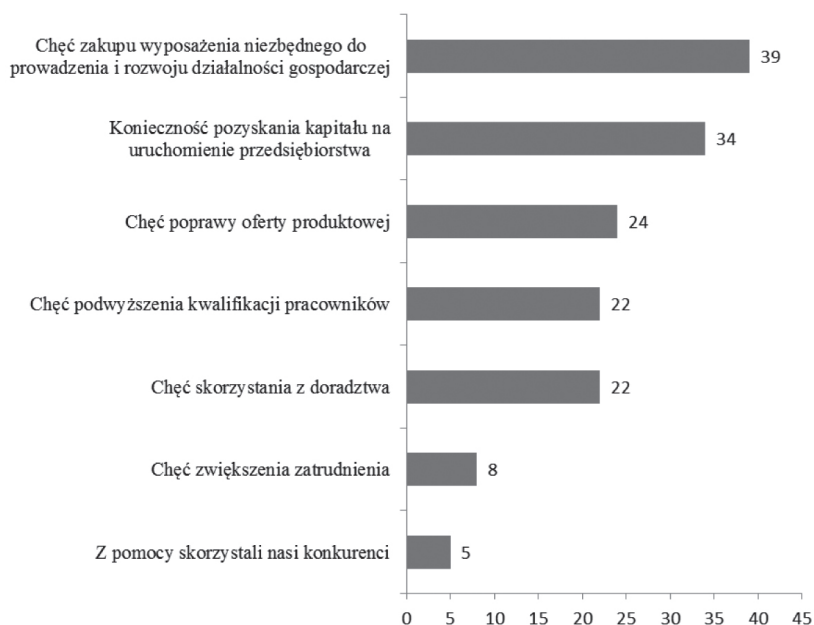
Rysunek 1. Przyczyny współpracy przedsiębiorstw z instytucjami otoczenia biznesu