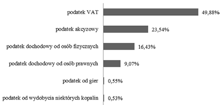
Rys. 1. Struktura planowanych dochodów podatkowych budżetu państwa w Polsce na 2015 r.

Należy zauważyć, że podatek VAT jest najbardziej dochodowym podatkiem w budżecie państwa polskiego (rys. 1). Na 2015 r. z tytułu podatku VAT zaplanowano wpływy w wysokości 134 630 000 tys. zł, co stanowi 49,88% łącznych wpływów podatkowych do budżetu państwa.