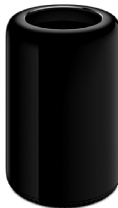
Mac Pro (2014 r.)

Rysunek 4. Jeden z pierwszych komputerów firmy Apple oraz produkt współczesny