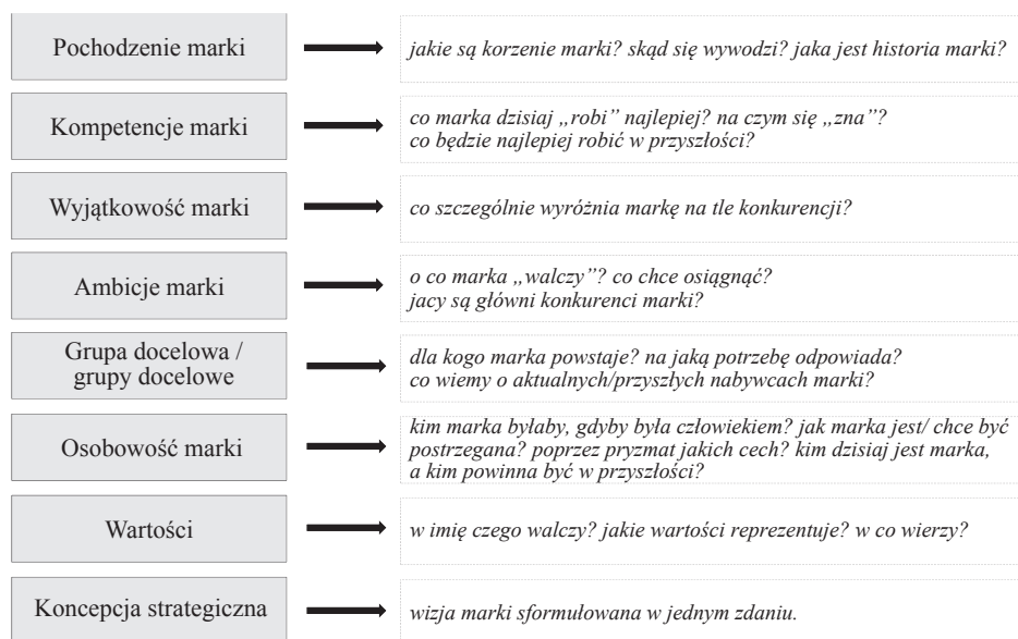
Rysunek 1. Brand Foundations – strategia marki wg firmy Corporate Profiles Consulting