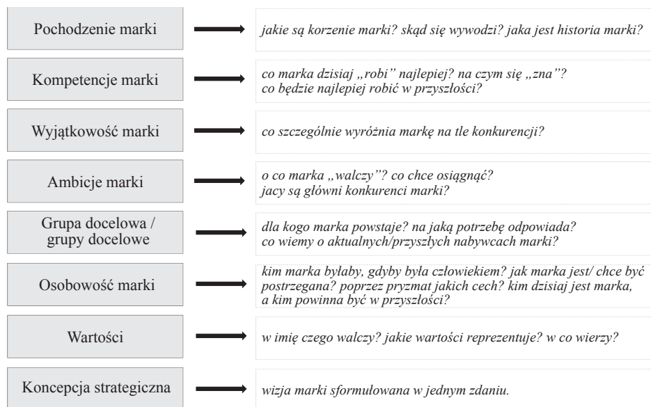
Rysunek 1. Brand Foundations – strategia marki wg firmy Corporate Profiles Consulting