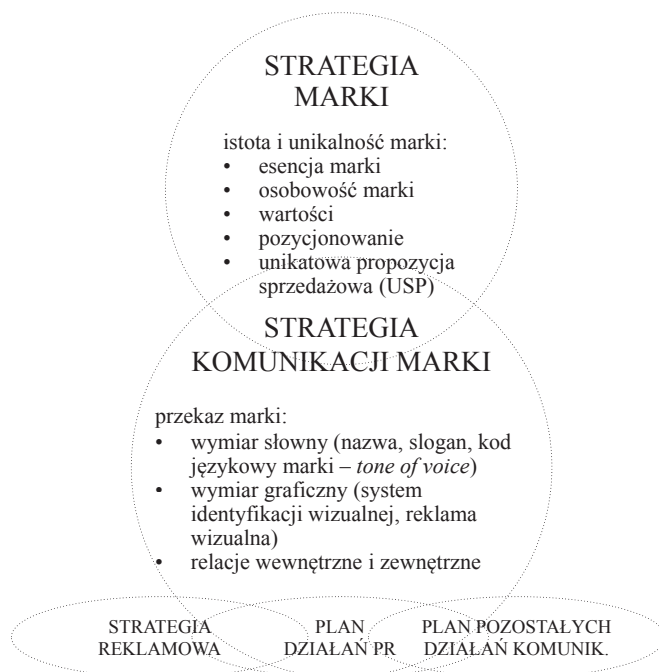
Rysunek 3. Strategia marki a strategia komunikacji marki

Komunikacja na poziomie werbalnym to specyficzny język marki, jej wymiar słowny. Najbardziej oczywistym elementem tego języka jest nazwa marki, która powinna odbiorcom czytelnie prezentować esencję marki. Oprócz wyboru nazwy marki i sloganu należy ustalić tzw. kod językowy marki ( tone of voice ), który jest zbiorem reguł rządzących stylem komunikacji werbalnej. Chodzi na przykład o dobór słownictwa używanego w komunikacji marki, sposób pisania tekstów reklamowych, itp.