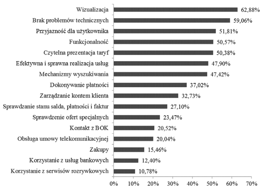
Rys. 2. Uśrednione oceny kryteriów jakości serwisów operatorów telekomunikacyjnych