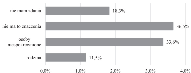
Rys. 2. Opinia kierowników gospodarstw rolnych odnośnie osób tworzących grupę producentów rolnych

Powyższe opinie rolników wskazują na istotną rolę stosunków międzyludzkich w integracji producentów rolnych. Potwierdzają to również kolejne wyniki badań, z których wynika, że dla części respondentów ważny jest skład członkowski potencjalnej grupy producenckiej.