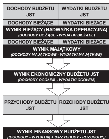
Rys. 1. Elementy równoważenia budżetu JST