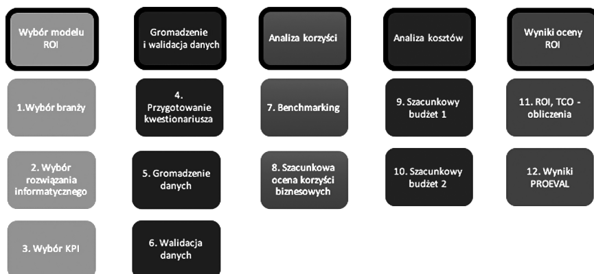
Rys. 3. Szczegółowy proces oceny PROEVAL