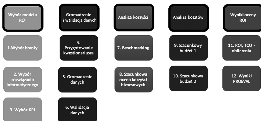
Rys. 3. Szczegółowy proces oceny PROEVAL