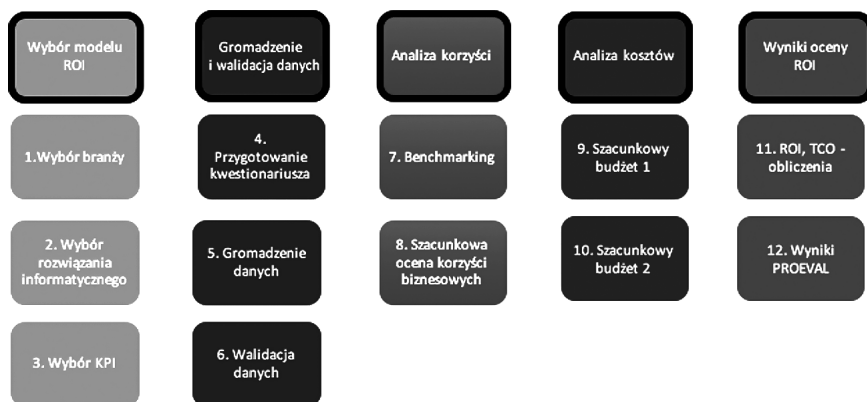
Rys. 3. Szczegółowy proces oceny PROEVAL