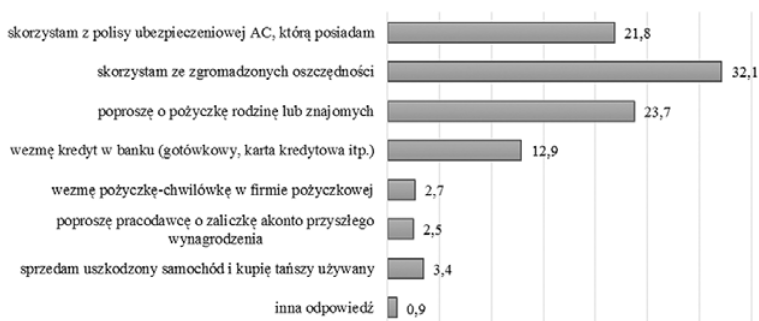
Rys. 2. Źródła finansowania nieprzewidzianych wydatków przez Polaków