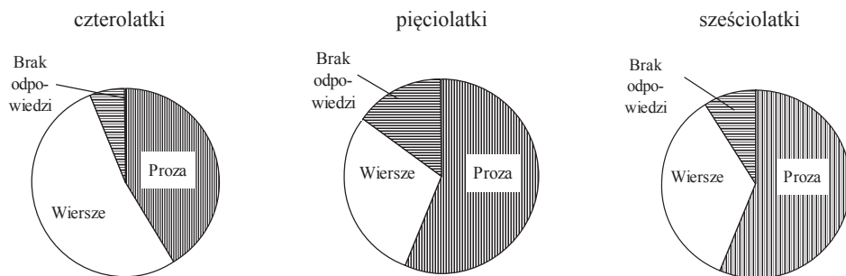
Rys. 4. Charakterystyka reakcji na zadania testowe: brak wypowiedzi lub jej rodzaj

Najwięcej wierszy zbudowały czterolatki (53%), a najmniej – pięciolatki (29%), natomiast sześciolatki stworzyły 35% wierszy. Grupa pięciolatek uzyskała najniższy wskaźnik procentowy odnośnie do liczby wierszy i najwyższy w zakresie prozy (56%), brak odpowiedzi był na poziomie 15%. W wypowiedziach dzieci sześciocioletnich również dominowała proza, ale w mniejszym stopniu. Ich rytmiczne kompozycje werbalne (35%) były często powtórzeniami pewnych schematów znanych wierszyków i wyrażeń. Zestawienie poszczególnych typów wypowiedzi w badanych grupach prezentuje rys. 4.