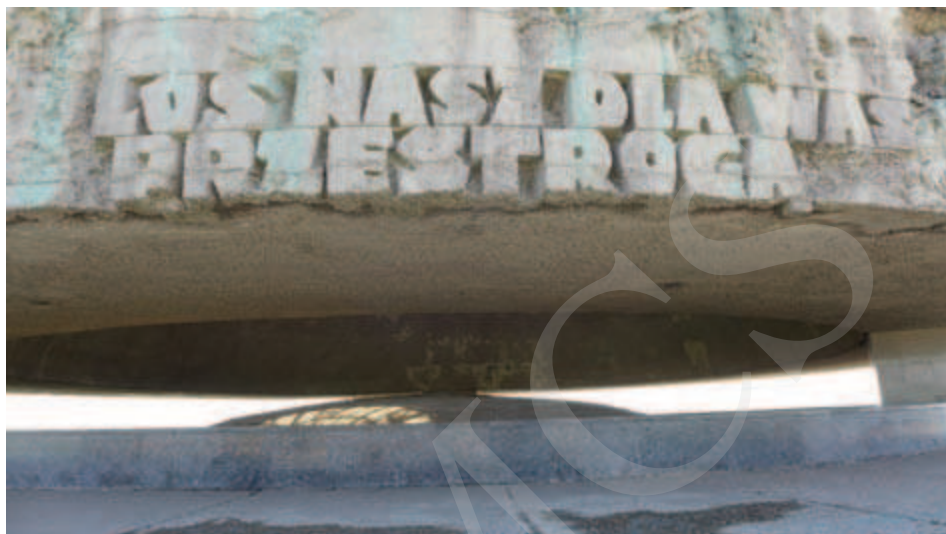
Ilustracja 6. Pomnik Walki i Męczeństwa Narodu Polskiego i Innych Narodów – Droga Hołdu i Pamięci – Mauzoleum (fragment), były niemiecki obóz koncentracyjny na Majdanku w Lublinie.

Ku czci ofiar hitlerowskich obozów zagłady wzniesiono w 1984 roku pomnik-mauzoleum na Powązkach Wojskowych w Warszawie, według projektu Stanisława Soszyńskiego. Zostały w nim umieszczone urny z prochami pomordowanych w czternastu różnych obozach koncentracyjnych. Konstrukcja budowli ma kształt ramp kolejowych, pomiędzy którymi umieszczono ślady butów, rampy zaś prowadzą do krzyża i tablicy o kształcie pieca krematoryjnego. Na tablicy widnieje napis: „Prochy Polaków pomordowanych w hitlerowskich obozach koncentracyjnych wołają o pokój świata”.