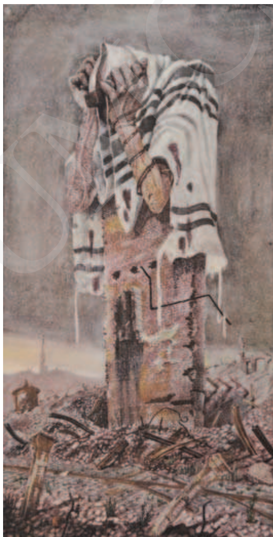
Ilustracja 4. Bronisław Wojciech Linke, El mole rachmim , 1946, z cyklu Kamienie krzyczą .

dookoła ręki, zrozpaczony, modlący się Żyd, jest owym „krzyczącym kamieniem” – fragmentem zrujnowanego domu, w pogorzelisku pogiętych tramwajowych szyn, w ruinach getta. Szczątki kamienicy przyjęły ludzkie kształty. Spersonifikowana budowla to wizerunek nie tylko zrujnowanej stolicy; w obliczu wielkich strat jest także sygnałem, że nie wszystko zostało utracone. Pozostał człowiek. Obraz Linkego, reprodukowany w licznych publikacjach poświęconych holocaustowi, można odczytać wielorako: jako hołd dla poległych, upamiętnienie ludzkich tragedii, głos lamentu, wreszcie bogaty w treści, metaforyczny komentarz autorski.