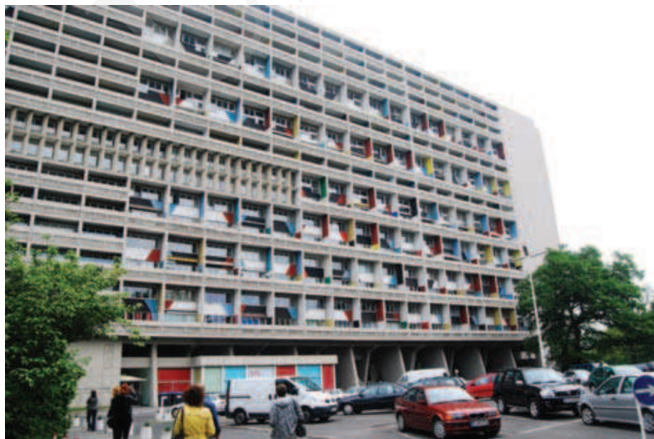
Ilustracja 10. Jednostka Berlińska, fot. A. Pilip (2010).

Budynek w Berlinie pozbawiony jest rzeźbiarskich elementów towarzyszących blokowi w Marsylii. Z kolei dach obiektu nie został przewidziany jako przestrzeń użytkowa. Architekt nie zaproponował wreszcie tak bogatego programu funkcjonalnego w postaci sal, bieżni itd., jak uczynił to w pierwowzorze. Także i sama lokalizacja berlińskiej jednostki nie jest tak spektakularna jak w przypadku bloku w Marsylii (położonego bezpośrednio nad Morzem Śródziemnym), przez co jego architektura często porównywana była do statku transatlantyckiego (zob. il. 10).