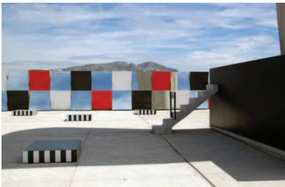
Ilustracja 9. Daniel Buren, instalacja Défini, Fini, Infini na dachu Jednostki Marsylskiej.