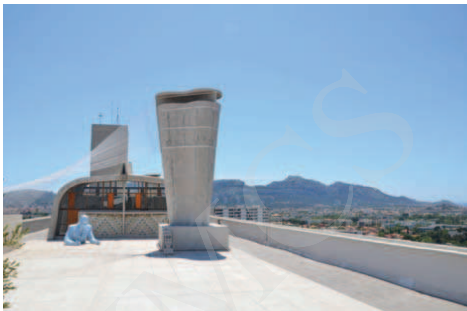
Ilustracja 8. Xavier Veilhan, instalacja Architectones na dachu Jednostki Marsylskiej (2013).