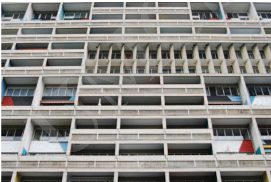
Ilustracja 11. Relief elewacji Jednostki Berlińskiej, fot. A. Pilip (2010).

Jednostka Berlińska posiada podobny, jakkolwiek znacznie zubożony schemat funkcjonalny; także i tu Le Corbusier zaprojektował pasaż handlowy dla mieszkańców. Do dzisiaj w budynku jednostki funkcjonują poczta i dostępny dla turystów hotel. Budynek ten, podobnie jak wszystkie inne realizacje szwajcarskiego architekta, przyciąga rzesze zwiedzających. Rozrzeźbiona elewacja i łamacze słońca ( brise soleil ) zastosowane w Berlinie przypominają wprawdzie realizację z południa Francji, równocześnie jednak przyjęte rozwiązania wydają się nieadekwatne do poziomu i natężenia insolacji w tym rejonie Europy (il. 11, 12).