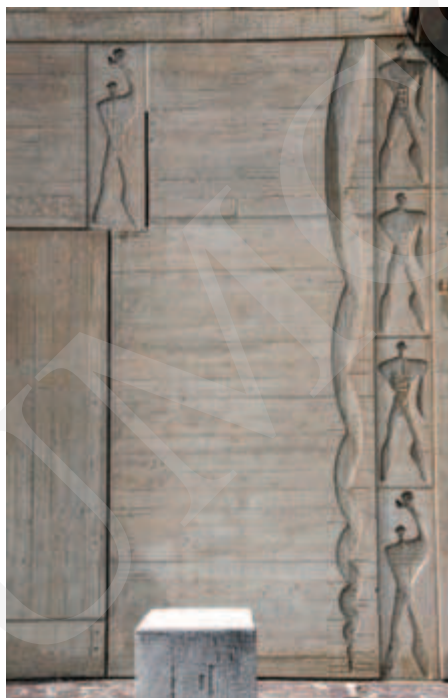
Ilustracja 4. Le Modulor na elewacji Unite d'Habitation , Marsylia, fot. K. L. Boguszewska (2014).

Budynek o wysokości 56 metrów, głębokości 24 i 137 metrów długości mieścił 337 mieszkań przeznaczonych dla 1600 osób. Jego schemat funkcjonalny oparty został na systemie dwukondygnacyjnych mieszkań o przekroju litery L 5 . Ich wysokość, a także inne parametry określone zostały przez system metryczny Modulor opracowany przez Le Corbusiera (zob. il. 4).