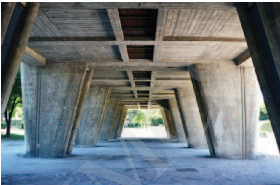
Ilustracja 5. Pilotis , Marsylia.

Swobodny przepływ przestrzeni miał dotyczyć całego budynku, w tym także dachu jednostki, który zyskał nową funkcję – stał się miejscem spotkań mieszkańców. W jego program wpisano funkcję przedszkola i sali sportowej. Wzniesiono także miejsca do siedzenia w postaci solarium, mały basen i bieżnię obiegającą budynek.