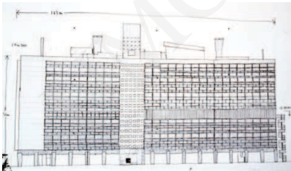
Ilustracja 1. Jednostka Marsylska na Biennale Architektury w Wenecji, wystawa w Arsenale, fot. K. L. Boguszewska (2010).

Blok Marsylski został wzniesiony na przełomie lat czterdziestych i pięćdziesiątych XX wieku na południu Francji. Obiekt ten, zwany także Cité Radieuse lub Unite d'Habitation , stał się symbolem i punktem zwrotnym w historii europejskiej architektury powojennej. Był to bowiem przykład budynku, który kształtował nową jakość przestrzeni w sposób totalny (zob. il. 1, 2, 3) 4 .