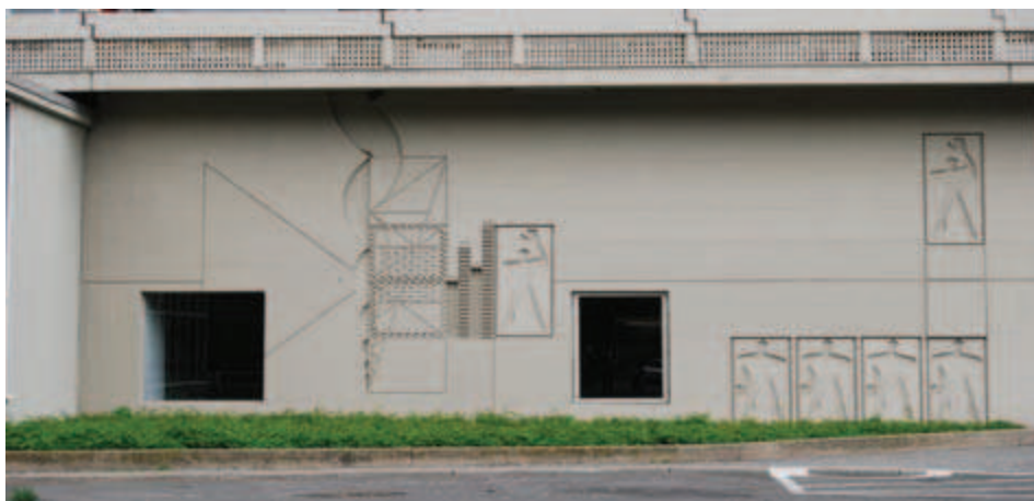
Ilustracja 12. Modulor na elewacji Jednostki Berlińskiej, fot. A. Pilip (2010).