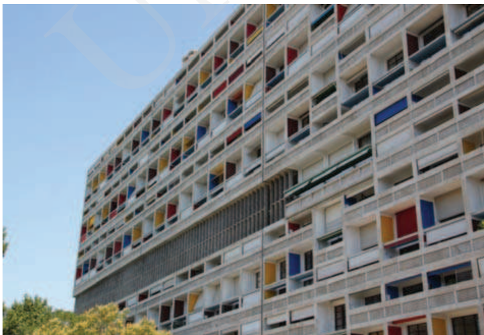
Ilustracja 3. Elewacja Jednostki Marsylskiej, Marsylia, fot. K. L. Boguszewska (2012).