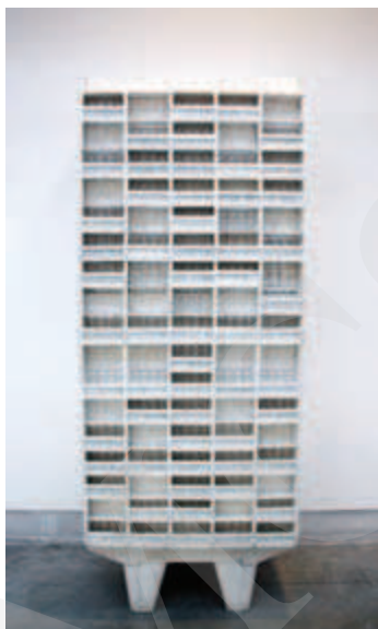
Ilustracja 2. Model Jednostki Marsylskiej na Biennale Architektury w Wenecji, wystawa w Arsenale, fot. K. L. Boguszewska (2010).