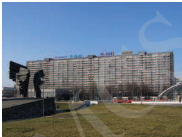
Ilustracja 13. Superjednostka w Katowicach 24 .

cają się widokami z okien na Beskidy, a przy dobrej przejrzystości powietrza – nawet na Tatry 23 .