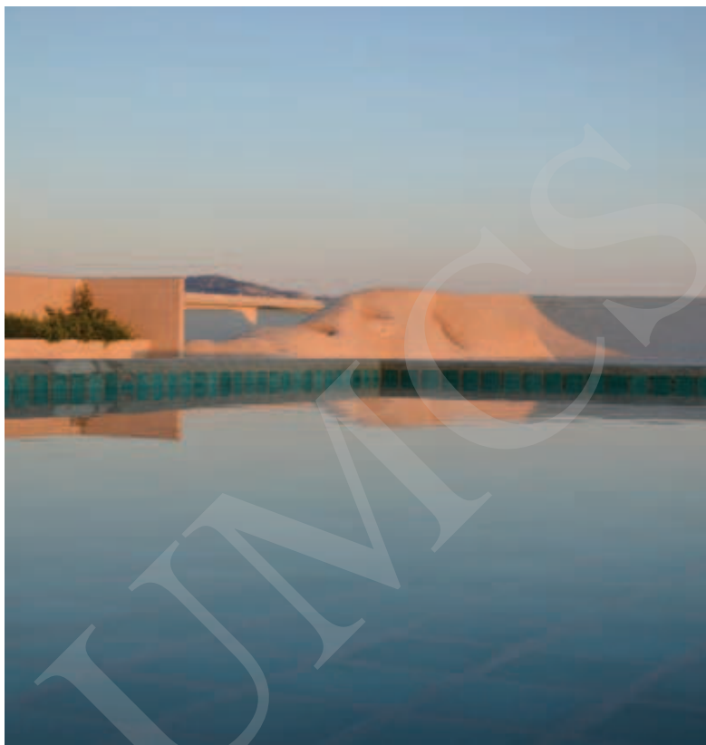
Ilustracja 6. Sztuczne góry Le Corbusiera na dachu Jednostki Marsylskiej.