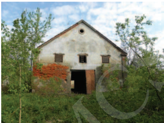
Ilustracja 5. Budynek magazynu – elewacja południowa, fot. M. Dudkiewicz (2012).