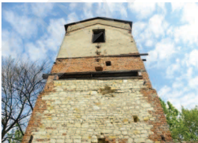
Ilustracja 6. Budynek suszarni chmielu – elewacja południowa.

Przeprowadzone analizy wskazują na brak opieki i niszczące zmiany w substancji zabytkowej parku i budynków zespołu dworskiego w Łęcznej. Inwentaryzacja ukazała zarastanie parku krajobrazowego, gdzie drzewa i krzewy tworzą niekontrolowane, przypadkowe skupiska oraz niszczące budynki folwarku. Niewątpliwie jednak obiekt zasługuje na uwagę ze względów historycznych, przyrodniczych oraz jako zabytek sztuki ogrodowej.