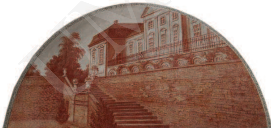
Ilustracja 5. Taras przypałacowy – malowidło z pałacu w Adampolu.