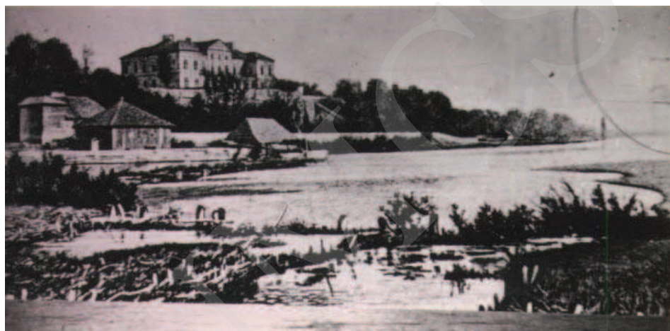
Ilustracja 2. Reprodukacja malowidła ściennego w pałacu w Adampolu. Stan pałacu w Różance po I wojnie światowej.

W roku 1972 wydano dokument o przekazaniu prawie 9 ha obejmujących park w Różance na Muzeum Wsi Lubelskiej, jednak decyzja ta nigdy nie weszła w życie, a tereny pozostały do dyspozycji Urzędu Gminy. Przez pewien okres urządzano na terenie parku obozy harcerskie i kolonie, a w latach 70. XX wieku na południowym obrzeżu założenia rozpoczęto budowę Domu Spokojnej Starości oraz budynków mieszkalnych 23 .