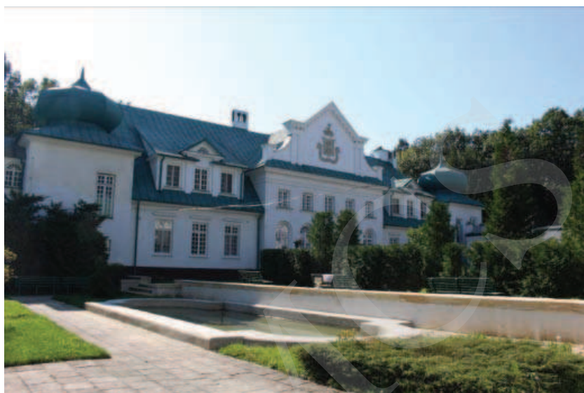
Ilustracja 12. Pałac w Adampolu.