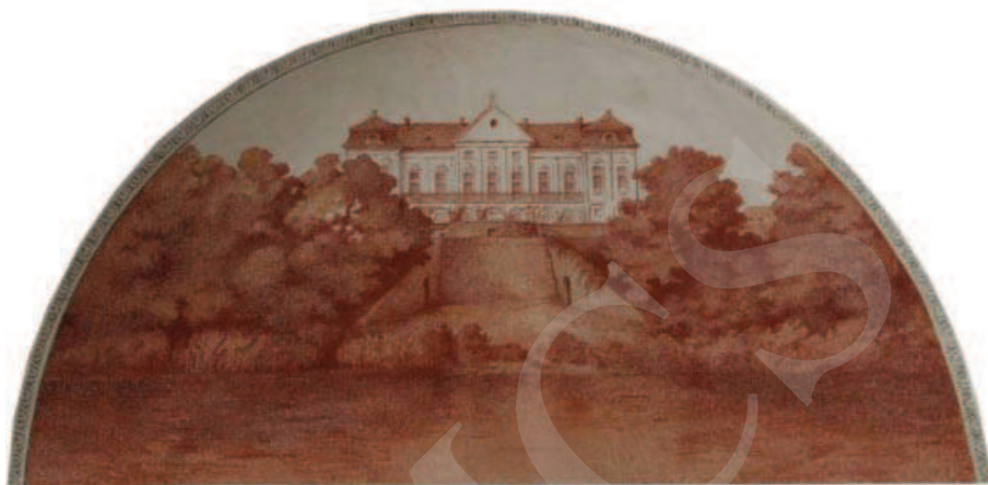
Ilustracja 4. Widok na pałac od doliny Bugu – malowidło w pałacu w Adampolu.