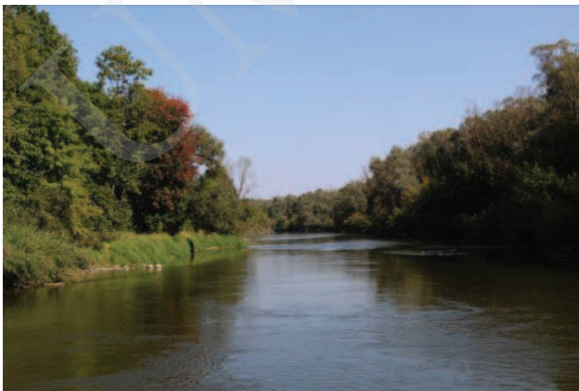
Ilustracja 11. Wschodnia granica parku w Różance – Bug.