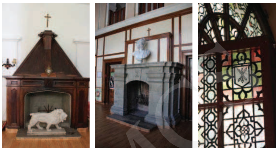
Ilustracja 7. Kominki oraz witraże w kaplicy w Adampolu – elementy przeniesione z pałacu w Różance.