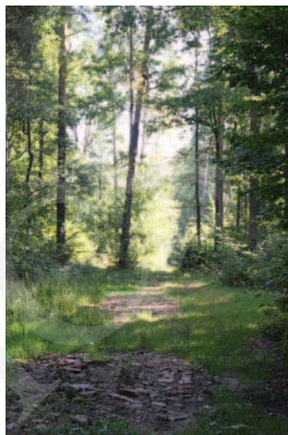
Ilustracja 15. Park w Adampolu.