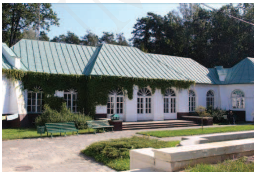
Ilustracja 13. Budynek oranżerii – zespół pałacowy w Adampolu.