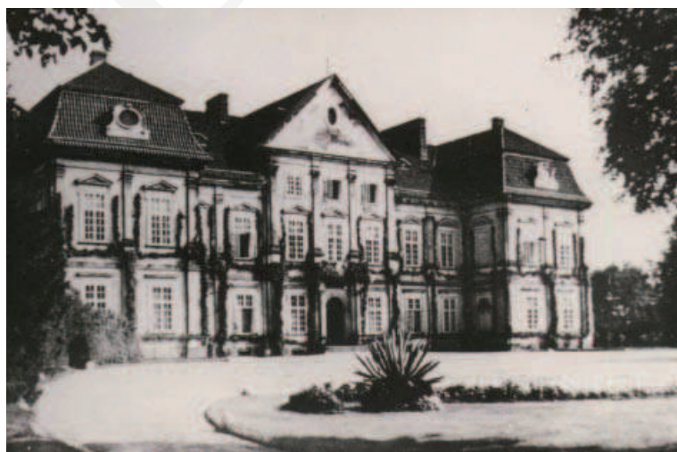
Ilustracja 3. Różanka, zachodnia elewacja pałacu. Stan z początku XX wieku. (Fot. w zbiorach p. Paprockiej, [za:] A. Obrębka, op. cit. )