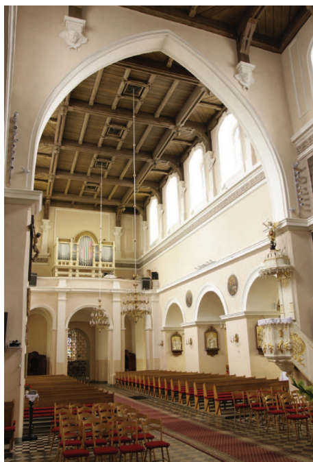
Ilustracja 3. Kościół farny we Wrześni – widok wnętrza ku zachodowi z prezbiterium (2009)