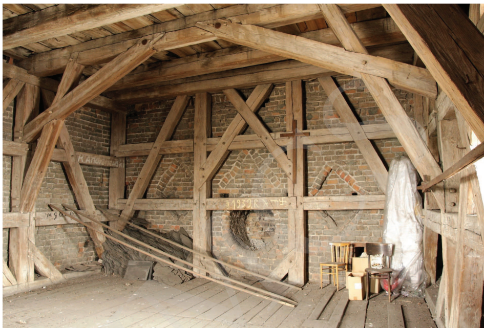
Ilustracja 4. Kościół farny we Wrześni – pozostałości dekoracji fasady korpusu pierwszej fazy. Widok z wnętrza wieży