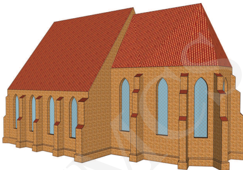
Ilustracja 10. Rekonstrukcja bryły kościoła farnego we Wrześni przed dobudowaniem wieży. Widok od południowego wschodu, oprac. W. Miedziak