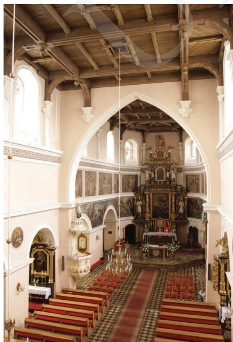
Ilustracja 2. Kościół farny we Wrześni – widok wnętrza ku wschodowi z chóru muzycznego, fot. M. Potocki (2009)