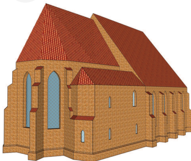
Ilustracja 9. Rekonstrukcja bryły kościoła farnego we Wrześni z aneksem emporowym, przed dobudowaniem wieży. Widok od północnego wschodu, oprac. W. Miedziak