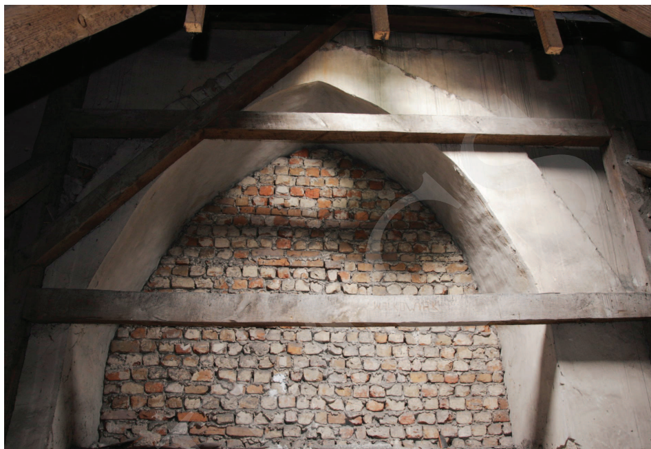
Ilustracja 6. Kościół farny we Wrześni – widok z poddasza nawy południowej na gotycką arkadę międzynawową