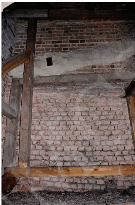
Ilustracja 8. Kościół farny we Wrześni – widok z poddasza obecnej zakrystii na zamurowane przezrocze empory, fot. M. Potocki (2009)