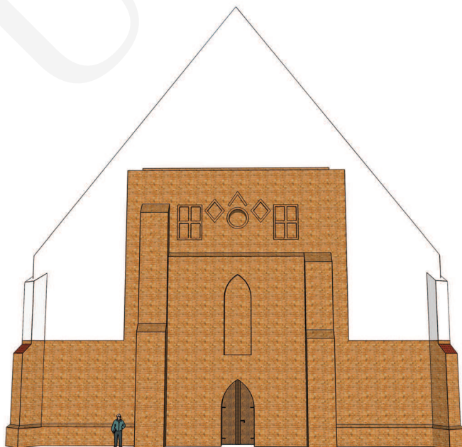
Ilustracja 5. Rekonstrukcja widoku elewacji zachodniej kościoła farnego we Wrześni przed dobudowaniem wieży. Na biało zaznaczone partie przekształcone w czasie późniejszym, oprac. W. Miedziak