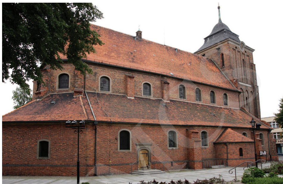
Ilustracja 1. Kościół farny we Wrześni – widok od strony północnej, fot. M. Potocki (2009)