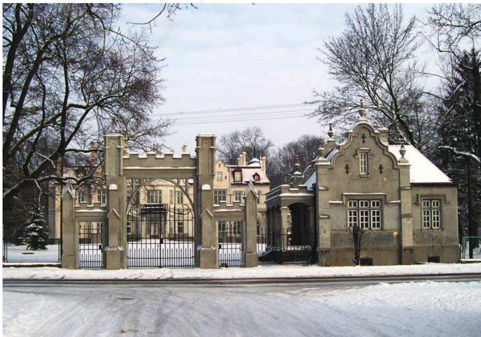
Il. 2. Pałac w Jabłoniu, brama wjazdowa i kordegarda, w głębi pałac. Fot. A. Cebulak, luty 2005.