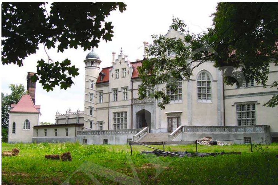
Il. 5. Pałac w Jabłoni, elewacja ogrodowa. Fot. A. Cebulak, lipiec 2006.