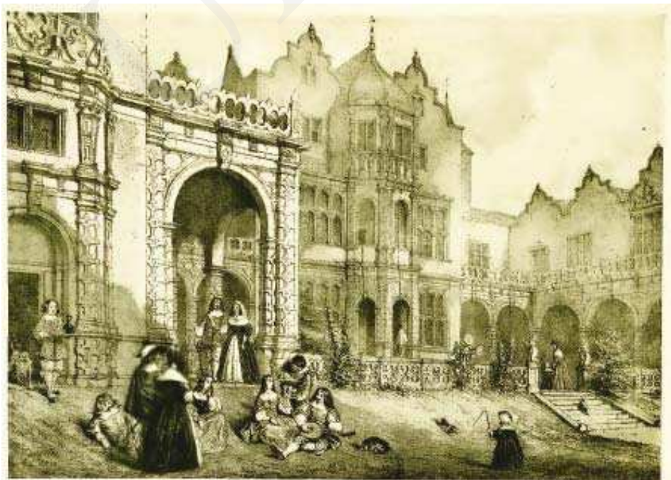
Il. 6. Holland House (Kensington). Repr. z: J. Nash, The Mansions of England in the Olden Time , New York 1912, ryc. 13.