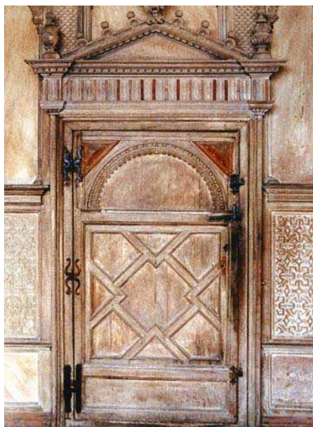
Il. 10. Haddon Hall , drzwi w Long Galery.