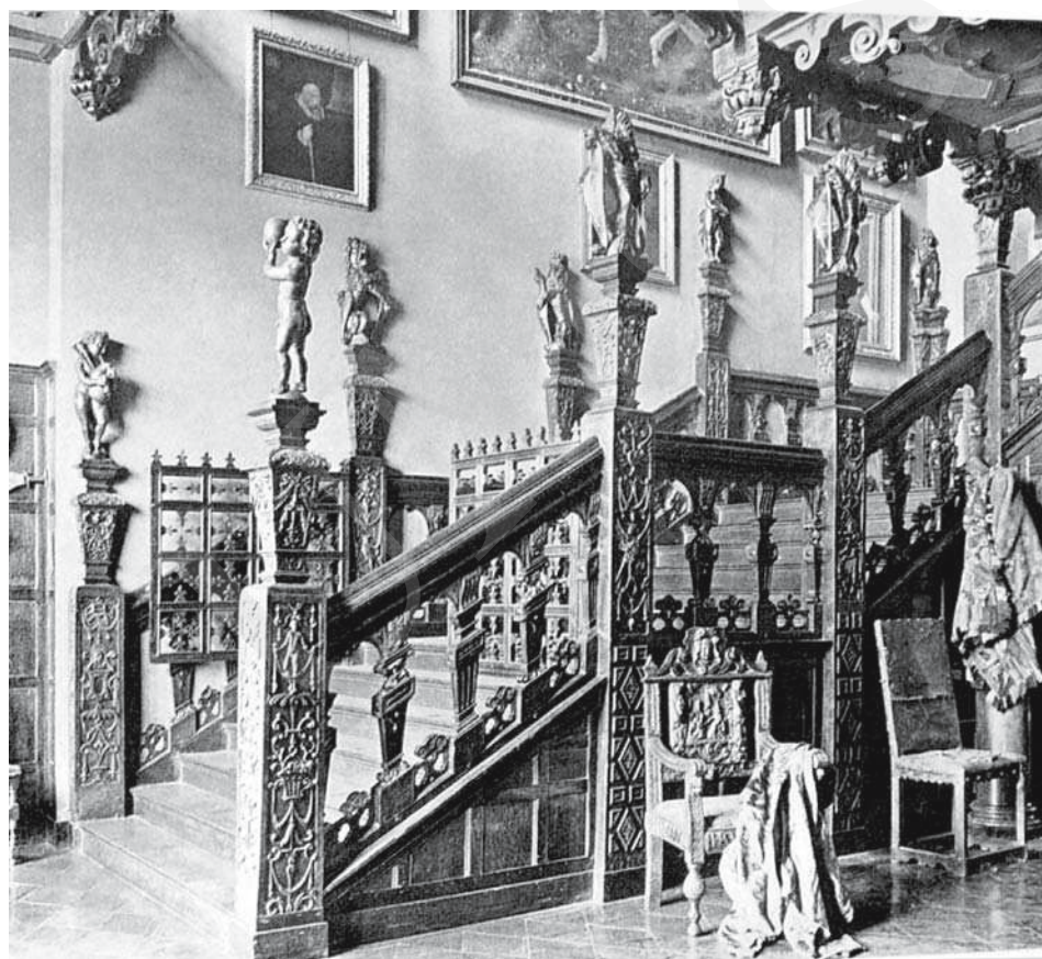
Il. 13. Hatfield House , klatka schodowa. Repr. z: Ch. Latham, In English Homes , Coventry 1904, s. 113.