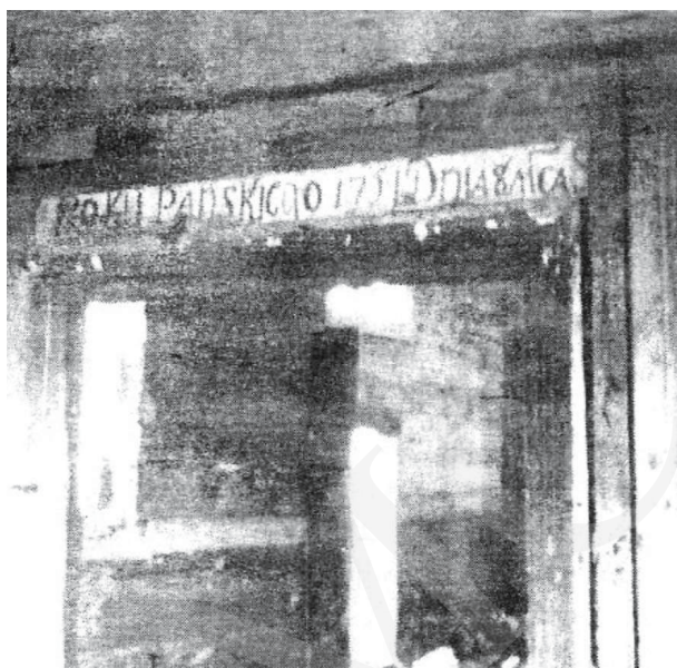
Il. 4. Michale – inskrypcja na nadprożu. Repr. z: O. Хведів, На кручі Бугу (Свято-Введнська церква села Михале). Історико-краєзнавчий нарис , Луцьк 2002, s. 11.