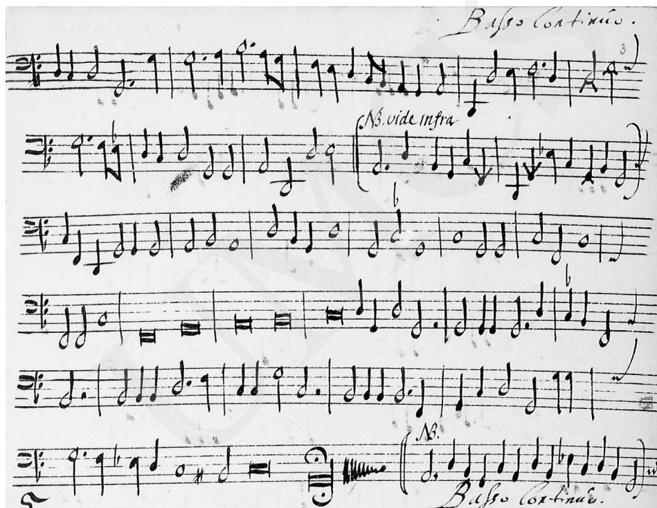
Ilustracja 4. Adam Jarzębski, Concerto quarto , t. 57-118. Slg Bohn Ms. mus. 111, Basso continuo [I], k. 3r.

na wolnym fragmencie szóstej pięciolinii, po ostatniej nucie utworu, dodając uwagę „NB. vide infra”. Ta ostatnia wersja odznacza się eleganckim rysunkiem basu, ale istnienie wersji „pośredniej” nie pozostawia złudzeń: jest to korektura obmyślona przez samego Sartoriusa, która nie ma nic wspólnego z wersją Jarzębskiego, ponieważ nie należy do żadnej możliwej linii filiacji tekstu.