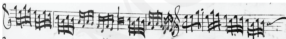
Ilustracja 3. Adam Jarzębski, Diligam te Domine , t. 36-39. Slg Bohn Ms. mus. 111, Prima vox, k. 3v.