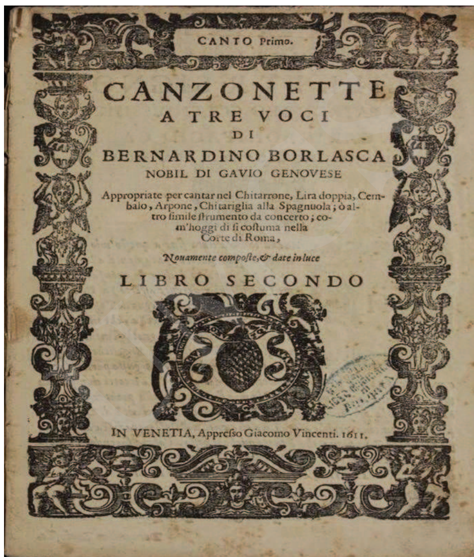
Ilustracja 4. Bernardino Borlasca, Canzonette , I-Bc, sygn. X. 140.