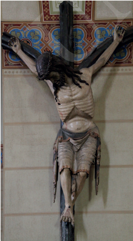
Ilustracja 10. Krucyfiks z kościoła Dominikanów w Friesach.