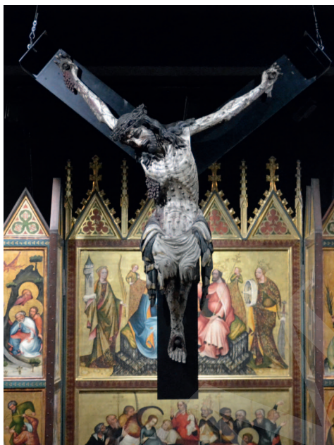
Ilustracja 1. Krucyfiks z kościoła Bożego Ciała we Wrocławiu, Ekspozycja Galerii Sztuki Średniowiecznej w Muzeum Narodowym w Warszawie.