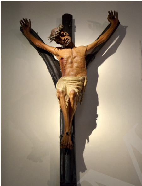
Ilustracja 9. Krucyfiks z kościoła św. Ignacego w Jihlavie.