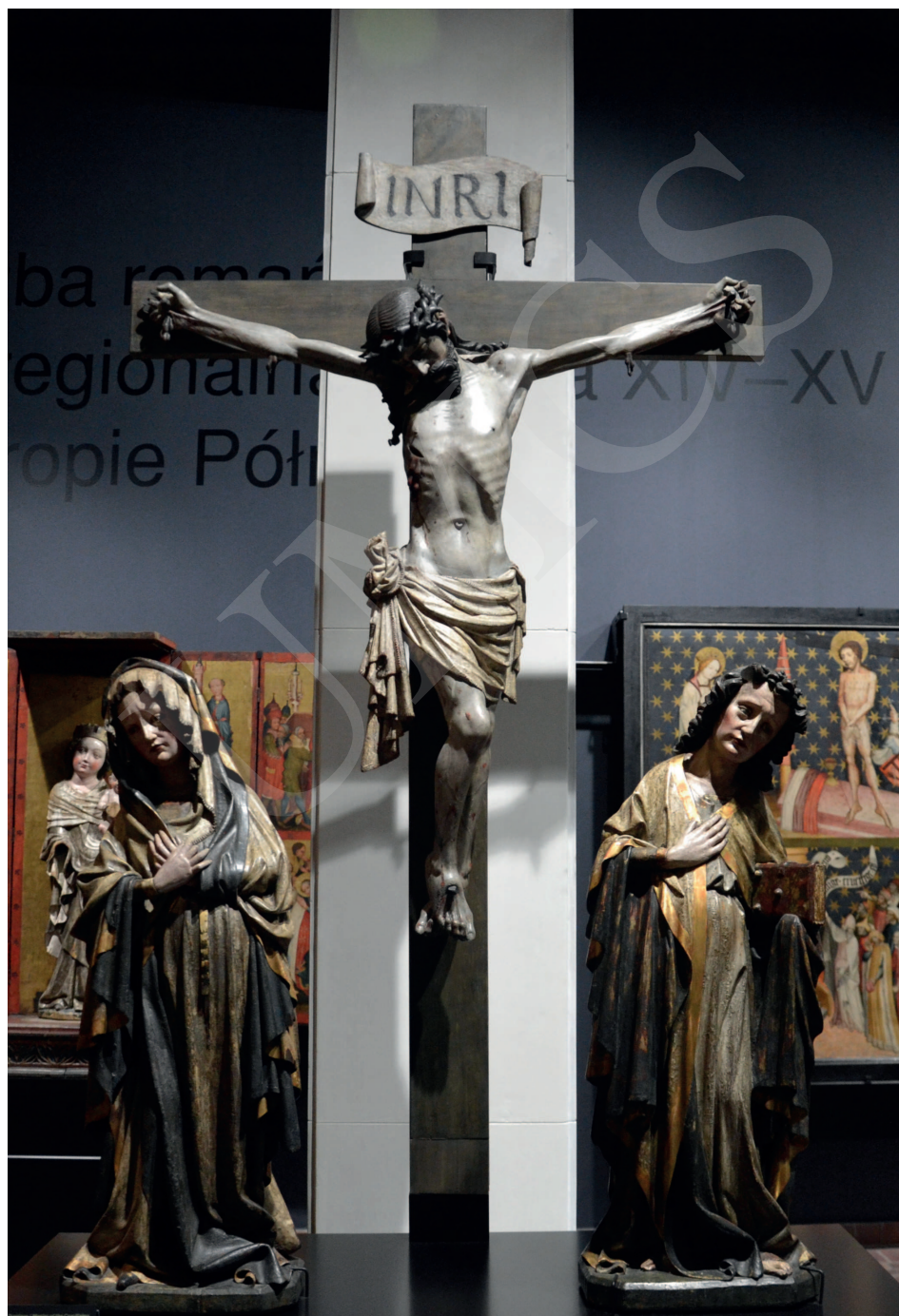
Ilustracja 19. Grupa Ukrzyżowania z kaplicy Dumlosych, Ekspozycja Galerii Sztuki Średniowiecznej w Muzeum Narodowym w Warszawie.