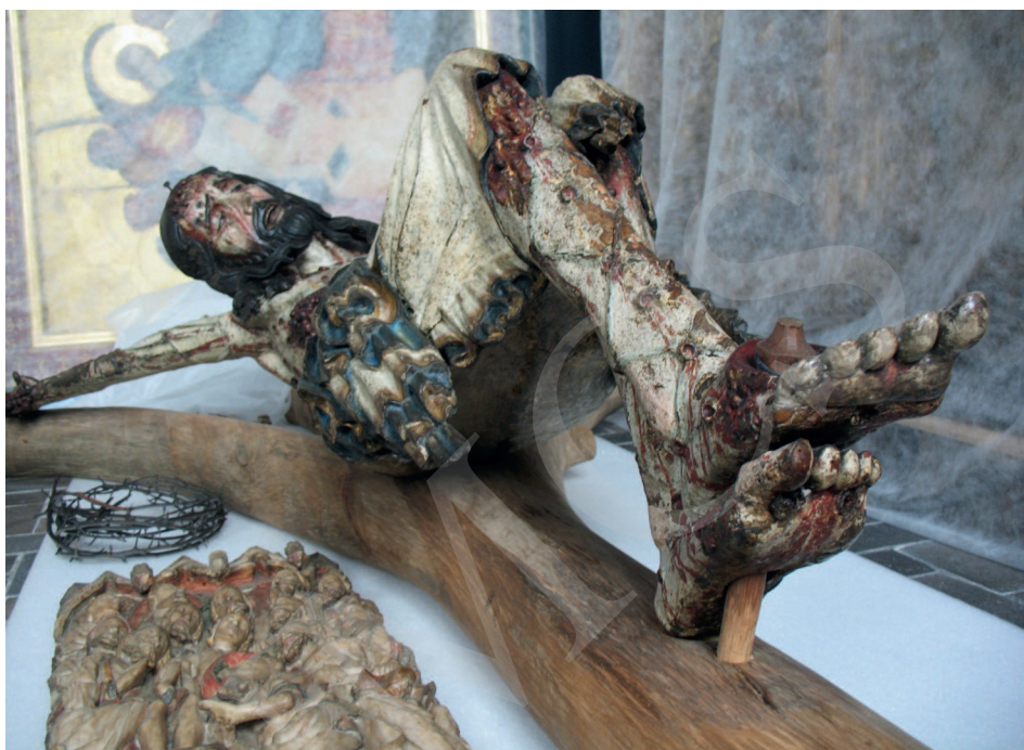
Ilustracja 5. Krucyfiks z kościoła Bożego Ciała we Wrocławiu, Ekspozycja Galerii Sztuki Średniowiecznej w Muzeum Narodowym w Warszawie.