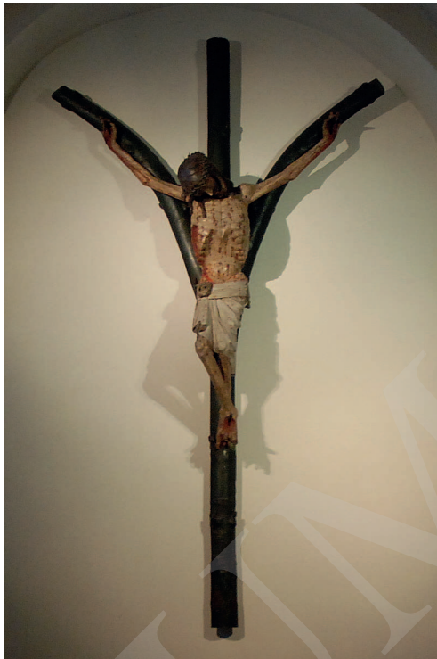
Ilustracja 11. Krucyfiks z kościoła Najświętszej Marii Panny na Kapitulu w Kolonii.