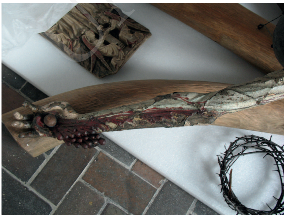
Ilustracja 2. Krucyfiks z kościoła Bożego Ciała we Wrocławiu, Ekspozycja Galerii Sztuki Średniowiecznej w Muzeum Narodowym w Warszawie.