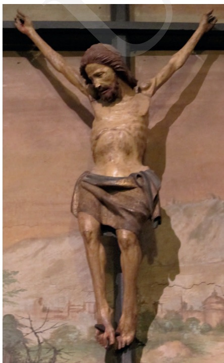
Ilustracja 14. Krucyfiks z kościoła św. Andrzeja w Pistoii.