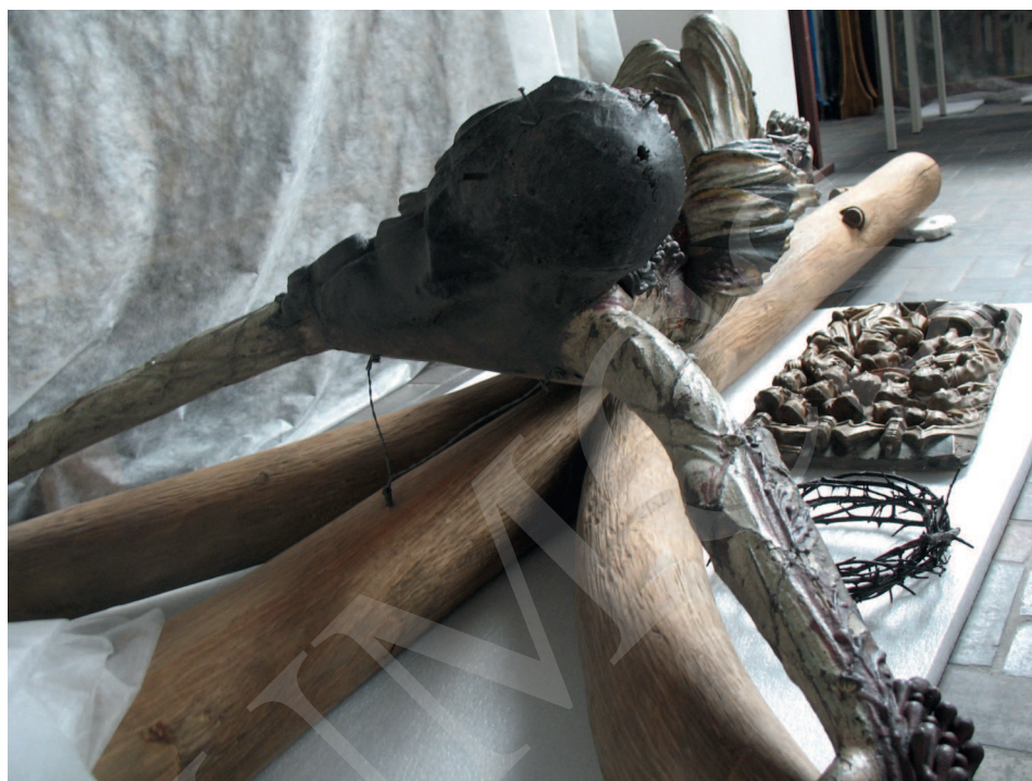
Ilustracja 3. Krucyfiks z kościoła Bożego Ciała we Wrocławiu, Ekspozycja Galerii Sztuki Średniowiecznej w Muzeum Narodowym w Warszawie.