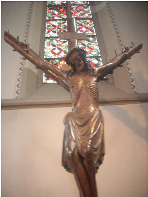
Ilustracja 12. Krucyfiks z kościoła św. Sykstusa w Haltern.