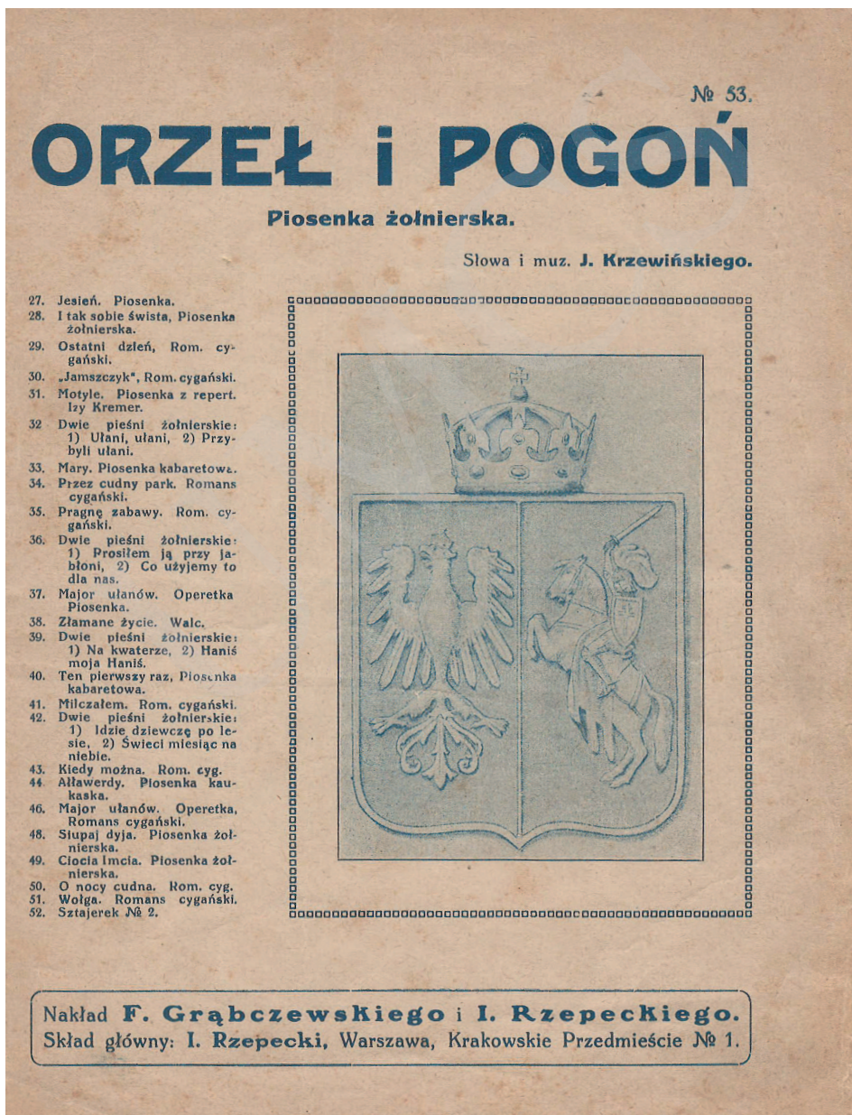
Ilustracja 2. Orzeł i Pogoń , słowa i muzyka Julian Krzewiński, druk z serii Wydawnictwa miniaturowe (nr 53), Warszawa b. r. w. (między 1921 a 1928); cd. na s. 92-93.