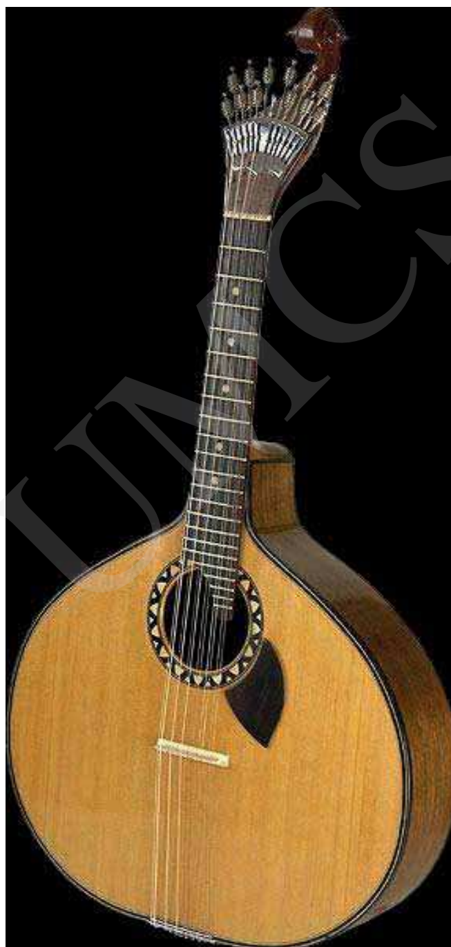
Ilustracja 2. Gitara portugalska