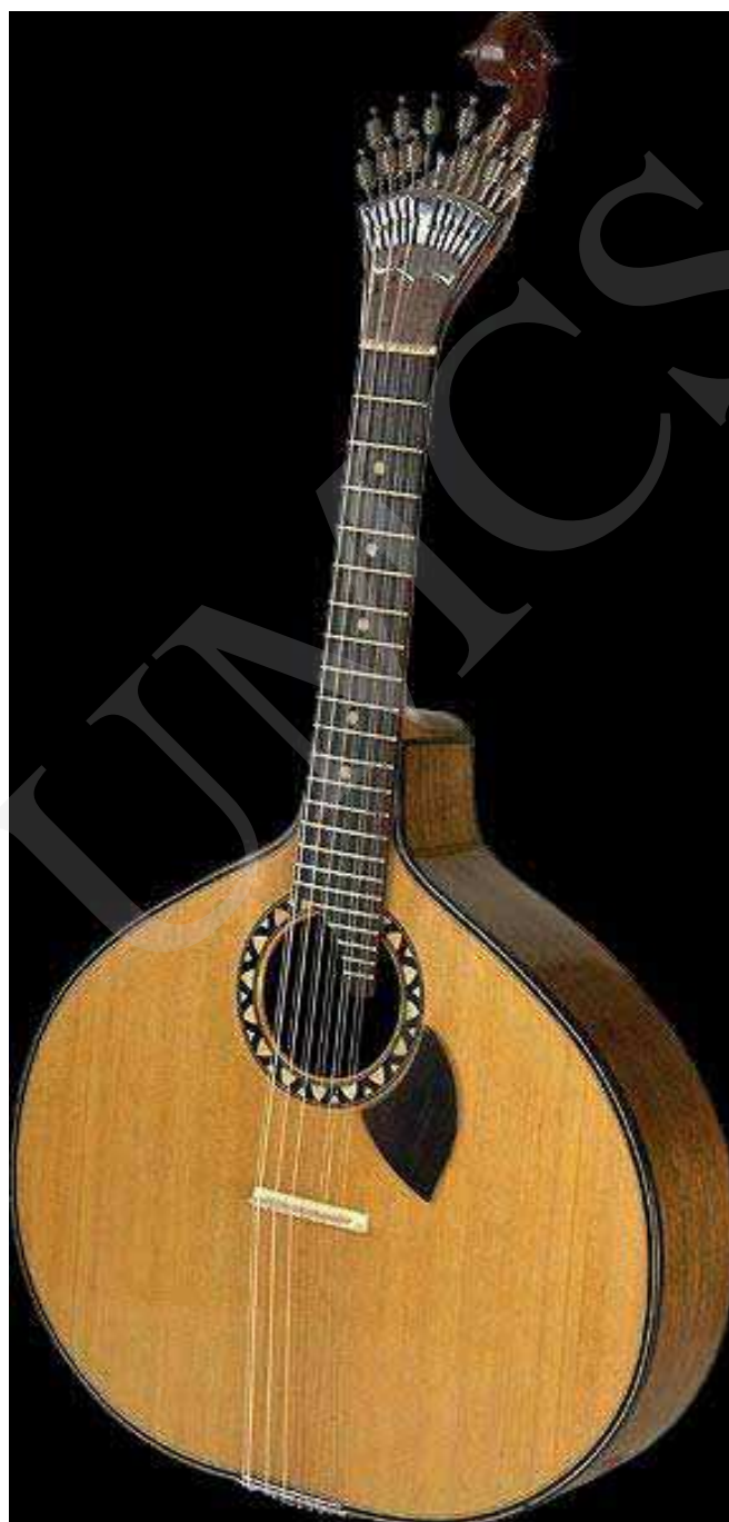
Ilustracja 2. Gitara portugalska, cyt. [za:] www.pinterest.co.uk/yvanroyen/fado [data dostępu: 02.01.2018].