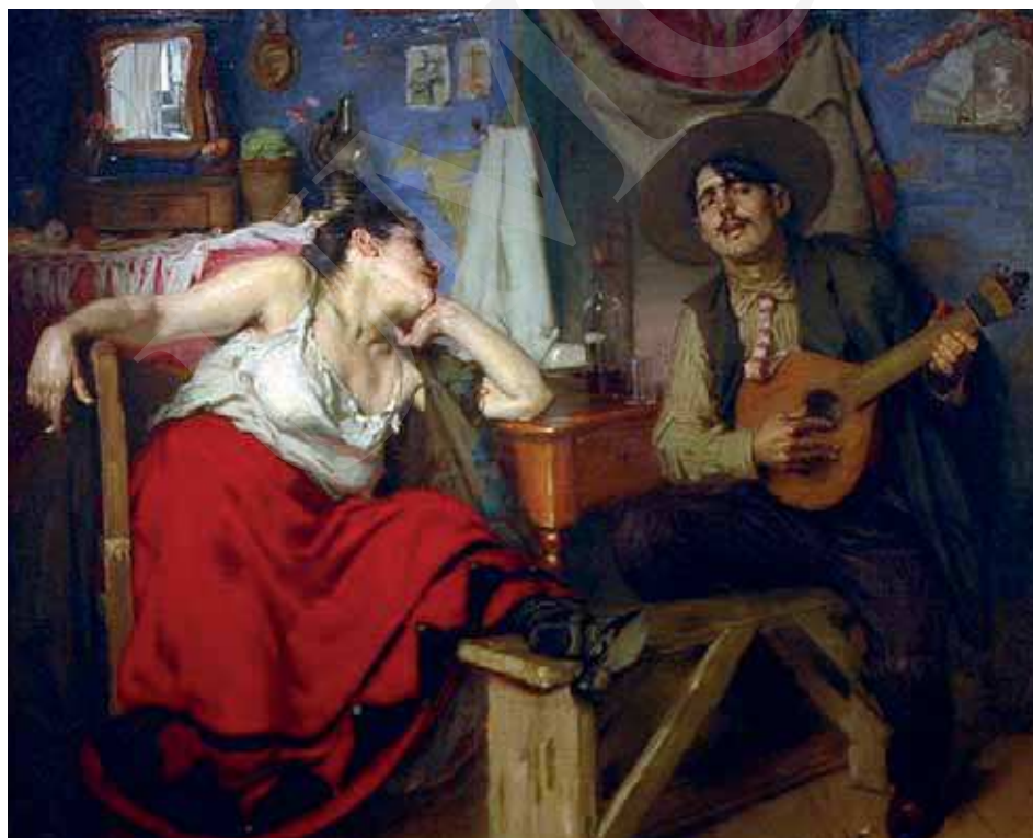
Ilustracja 1. Jose Malhoa, Fado , 1910, olej na płótnie, 150cm×183cm, Museu da Cidade, Lizbona; cyt. [za:] Vieira Nery, op. cit. , s. 87.

Warto w tym miejscu odnotować reakcje sztuk pięknych. Wokalno-instrumentalna interpretacja fado stała się na początku XX wieku natchnieniem dla portugalskiego malarza José Malhoa, który jedną ze swoich prac opatrzył tytułem Fado .