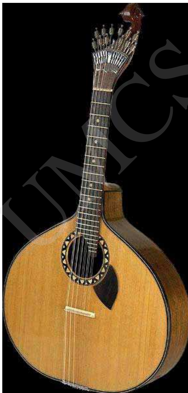
Ilustracja 2. Gitara portugalska, cyt. [za:] www.pinterest.co.uk/yvanroyen/fado [data dostępu: 02.01.2018].