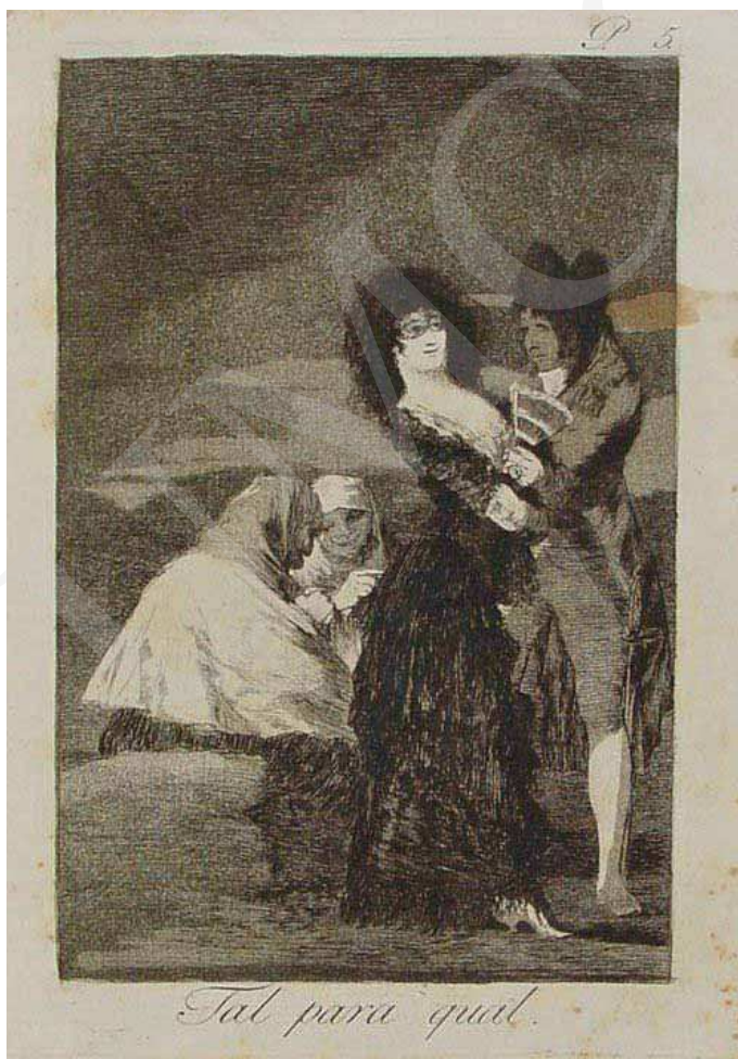
Ilustracja 1. F. Goya, Kaprys 5: Tal para qual , 1797-1798, akwaforta z akwatiną, 21,7cm x 15,2cm.

Aragonii) oraz dwie nieopodal siedzące starsze kobiety. Goya, komentujący swoją pracę, opatrzył ją następującymi słowami: „Stare kobiety nie mogą powstrzymać śmiechu, bo wiedzą, że nie ma on ani grosza” 18 . Los requiebros od strony muzycznej tworzy zestaw wariacji bazujących na dwóch frazach tonadilla 19 , pochodzących z utworu hiszpańskiego kompozytora Blas de Laserna Nieva (1751-1816).