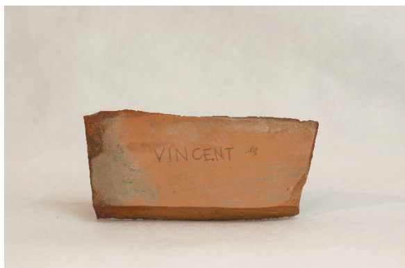
Fot. 3. Kamień „Vincent”