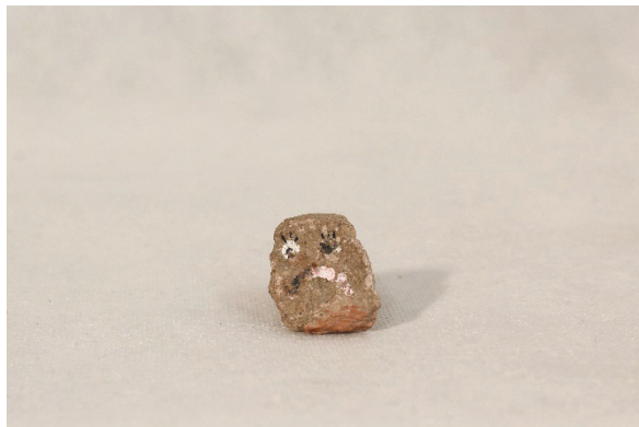
Fot. 2. „Smutny Kamień”

spodobała się większości studentów. Również w tym wypadku nie został przeze mnie określony precyzyjny czas powstania tekstów.