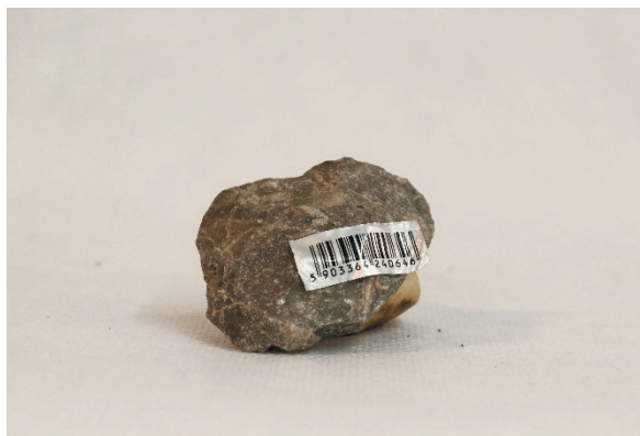
Fot. 3. Jeden z kamieni

W szóstym dniu warsztatu zastanawialiśmy się nad tym, jak zrealizować trudne przedsięwzięcie wydania książki. Wszak opublikowanie prawie 50 tekstów literackich to niemałe przedsięwzięcie edytorskie, logistyczne i ekonomiczne. Z wielu różnych pomysłów, w demokratycznym głosowaniu, wybrana została koncepcja stworzenia wydawnictwa unikatowego, realizowanego własnymi siłami i środkami grupy.