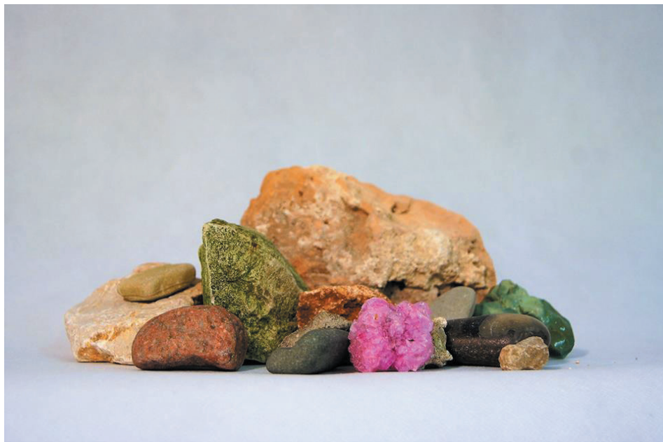
Fot. 1. Kamienie użyte w trakcie warsztatu