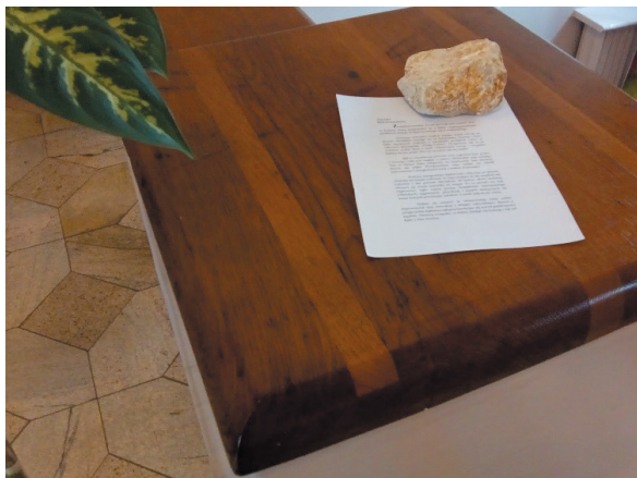
Fot. 3. „Geocatching” w murach wydziału