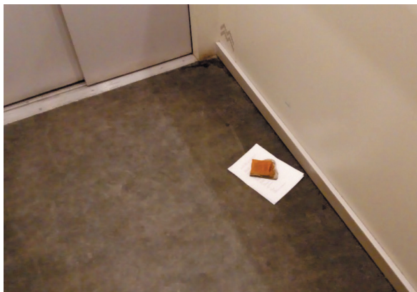
Fot. 3. „Geocatching” w murach wydziału