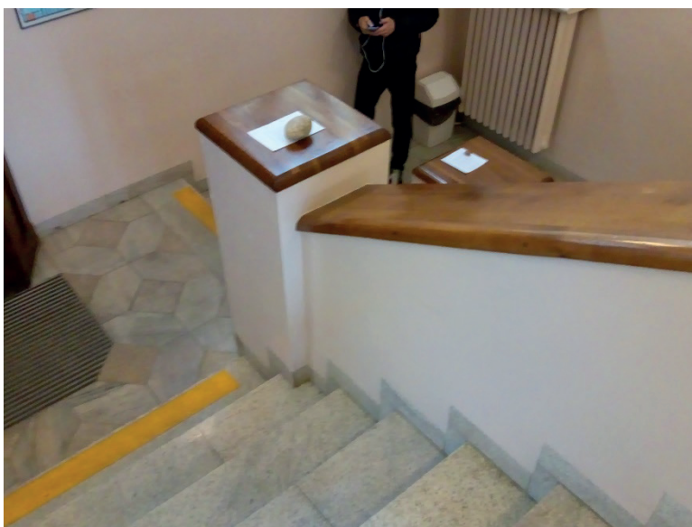
Fot. 3. „Geocatching” w murach wydziału – fot. Marcin Cabak

Szóste spotkanie warsztatowe poświęcone było realizacji planu filmowego, która rozpoczęła się przedyskutowaniem formy, w jakiej zostanie zrealizowane wystąpienie każdej z chętnych osób i sposobu, w jaki się zaprezentuje. Studenci ustalili, że ujęcia filmowe zostaną ograniczone do ważnych z subiektywnego punktu widzenia autorów fragmentów napisanych przez nich tekstów, tak, aby zbędnie nie rozbudowywać narracji filmowej oraz zbliżeń i półzbliżeń budujących nastrój intymności i bezpośredniości wypowiedzi.