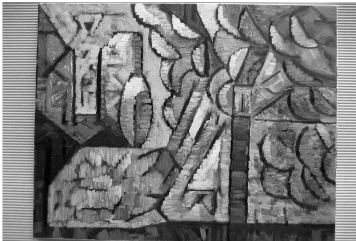
Fot. 2. Obraz O. Stanisławskiej (olej), ilustracja do wiersza Zaproszenie

Recenzowany tomik posiada wszystkie atuty pięknej książki dla młodego czytelnika. Architektura tej publikacji jest bardzo spójna z przekazem werbalnym. Treść podkreślają zamieszczone tu ilustracje, które wykonała O. Stanisławska, absolwentka kierunku artystycznego w Częstochowie, autorka wielu realizacji malarskich i użytkowych, uczestniczka licznych wystaw malarskich.