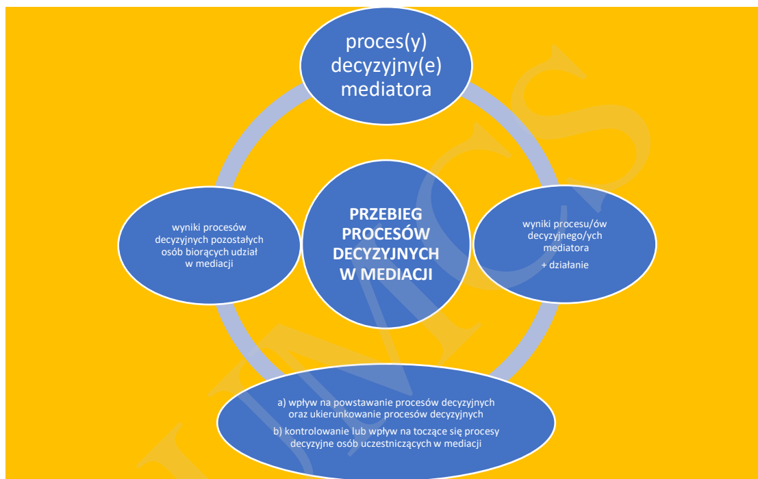
Rysunek 1. Przebieg procesów decyzyjnych w mediacji

oddziaływanie procesów decyzyjnych i działań wszystkich osób biorących udział w mediacji z uwzględnieniem mocnego wzajemnego powiązania 45 .