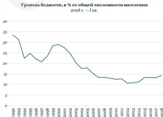
Таблица 1. Динамика уровня бедности в России (1992–2018 г.г.)

Источник: Уровень и черта бедности в России ,