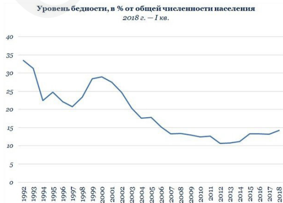
Таблица 1. Динамика уровня бедности в России (1992–2018 г.г.)